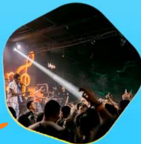
Palc o BHFM