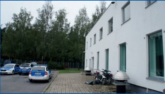
Viro. Erillinen sisäänkäynti takakautta Tartumaan uhrien tukikeskukseen.

Virossa sijaitseva Tartumaan uhrien tukikeskus ( Tartumaa Ohvriabikeskus ) on tehnyt erillisen sisäänkäynnin rakennuksen takaosaan erityisen traumatisoituneille lapsille. Myös osassa Suomen oikeussaleista on erilliset sisäänkäynnit, ja erilliset sisäänkäynnit ja odotushuoneet ovat erityisen korkealle arvostettuja oikeustalojen ominaisuuksia Yhdistyneessä kuningaskunnassa.