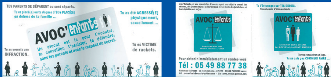
Tässä mainostetaan lapsiin erikoistuneiden asianajajien ohjelmaa (Avoc'enfants). Siviili- tai rikosasioissa osallisina olevat lapset ja nuoret voivat ottaa yhteyttä lapsiin erikoistuneeseen asianajajaan ja saada neuvoa ja tietoa oikeuksistaan.

Ranskassa useisiin kaupunkeihin on perustettu yhteyspisteitä, joissa lapset voivat käydä lapsiin erikoistuneiden asianajajien juttusilla ja saada tietoa oikeuksistaan sekä neuvoa ja tukea siviili- tai rikosasioissa. Nämä tapaamiset ovat maksuttomia ja luottamuksellisia, ja tarjolla on usein sekä paikan päällä annettavaa neuvontaa että puhelinvälisiä ja kouluissa järjestettäviä tietoiskuja.