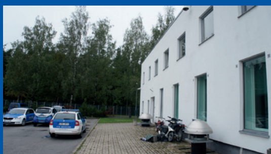
Estonie. Entrée séparée à l'arrière du bâtiment du Centre d'aide aux victimes de Tartumaa.

Le centre d'aide aux victimes de Tartumaa ( Tartumaa Ohvriabikeskus ), en Estonie, a aménagé une entrée séparée à l'arrière du bâtiment pour les enfants particulièrement traumatisés. En Finlande, certaines salles de tribunal disposent également d'entrées séparées, et au Royaume-Uni, les entrées et les salles d'attente séparées sont des aspects extrêmement appréciés dans les tribunaux.