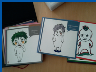
Finlande, Kuovola. Matériel utilisé pour les auditions d'enfants en fonction de leur âge et de leur maturité.