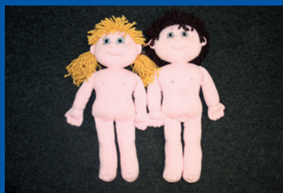
Tallinn, Estonie. Poupées utilisées pour les auditions d'enfants.

type d'informations fournies et quand et par qui elles le sont. Le droit à l'information est moins réglementé en matière civile, où les professionnels du droit et les travailleurs sociaux ont davantage de liberté pour juger quelles informations doivent être communiquées à un enfant.