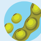
Soya o soja