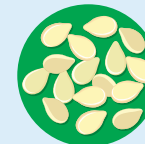
Sésamo o ajonjolí