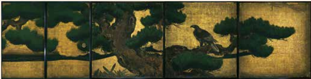
「松鷹圖」大廣間 四之間

因此，在修繕之際，開展了「世界遺產・二條城一口城主募捐」活動。敬請大家溫情支援。