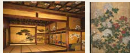
黑书院 从二之间看一之间 黑书院 牡丹之间

将军同与德川家关系亲密的大名、高位的朝臣在此处见面。因此，是一个充满亲切氛围的空间。一之间与二之间因盛开的樱花引人注目而被称为“樱之间”，将军背后的朦朧擎雪的松枝与梅花、飘洒的樱花交相辉映，让人感受到季节的变迁。障壁画是狩野探幽的弟弟狩野尚信所画。