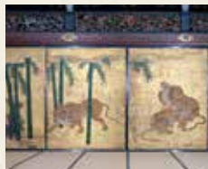
远待 三之间 竹林群虎图

远待是来殿者的等候场所，是二之丸御殿最大的建筑物。来殿者首先进入的这些房间，由于隔扇及墙壁上的绘画而被称为“虎之间”。凶猛的老虎图及宏伟的空间令人感到德川家权力之大。