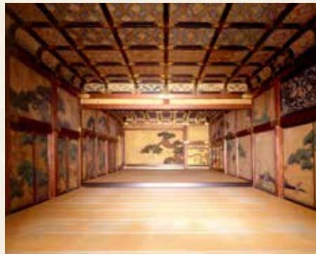
表明了大政奉还的大广间 从二之间看一之间

大广间是二之丸御殿的主室，是将军接见大名及朝臣们的房间。大广间的主要房间有“一之间”与“二之间”。一之间的地板比二之间高。接见时，将军在一之间朝南而坐。一之间有被认为曾经挂了三幅挂轴的壁龛，其旁边有摆放工艺品的错位板架。对面的右侧有称为帐台构的装饰门，装点着红色的流苏。左侧是付书院(像凸窗那样挑出廊子的书桌)。障壁画是狩野探幽的作品。