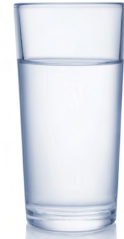
Agua o bebidas sin calorías

Este plato lleva judías verdes cocidas, col, puré de patatas y carne de cerdo desmenuzada.