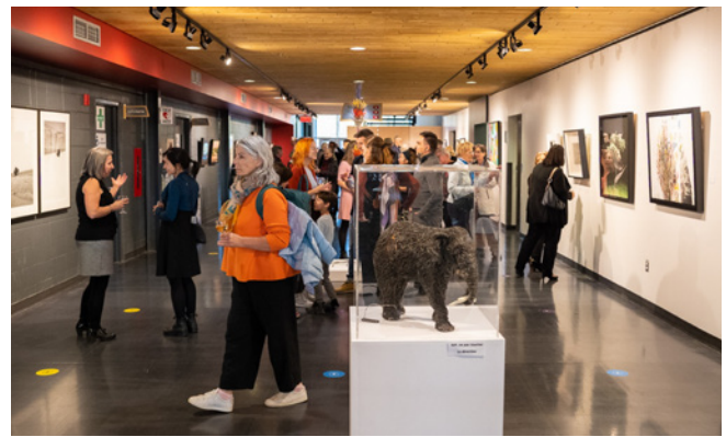
Vernissage de l'exposition La nature nous habite à Lac-Mégantic

Le 25 octobre avait lieu le gala Les Vivats, qui récompensent les événements ayant choisi de réduire leur empreinte environnementale et d'améliorer leur impact social et économique. C'est avec fierté que nous avons vu deux Rendez-vous Loto-Québec s'y démarquer en remportant des prix, soit le FestiVoix de Trois-Rivières et le Festival International Nuits d'Afrique.