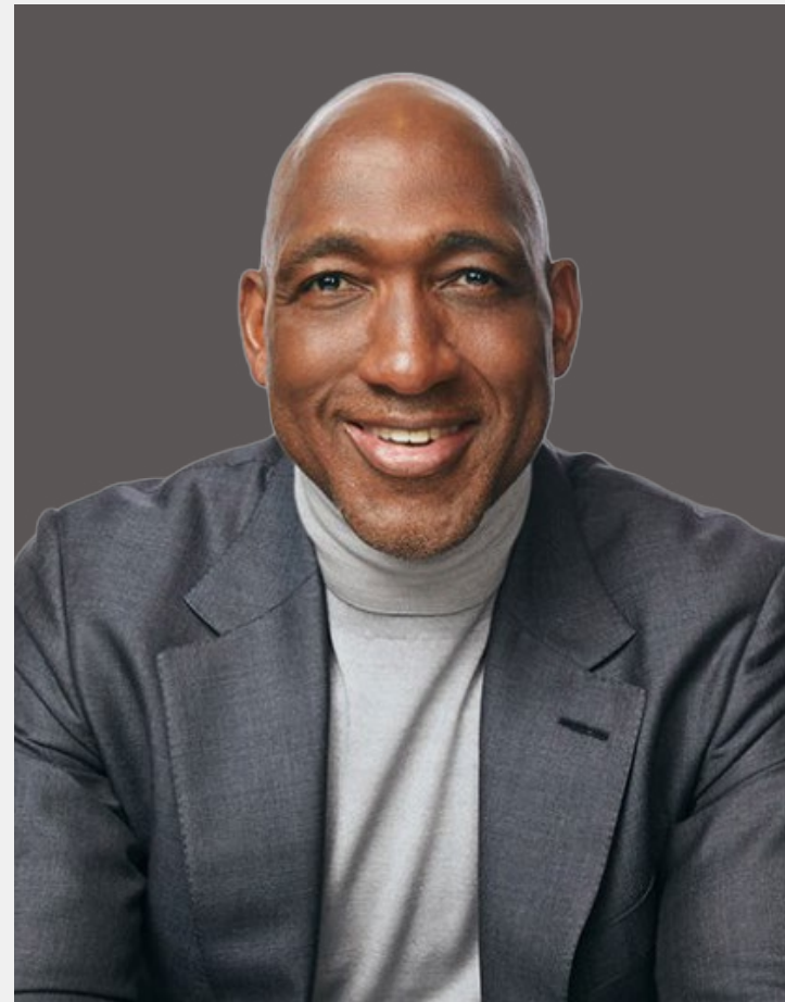
ديريكا و. رايس رئيس لجنة التدقيق مجلس إدارة شركة Bristol Myers Squibb

شكراً لك على التزامك بمبادئنا للنزاهة والتصرف دائماً وفقاً لقيمنا واتخاذ القرارات الصائبة للمرضى على الدوام.