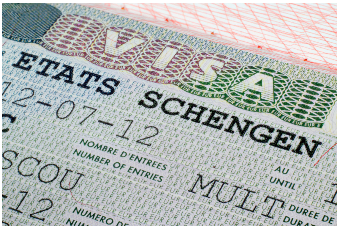
Schengenvisum i ett pass.

Läs mer om hur Europol rustar upp för att bättre bekämpa brottslighet och terrorism .