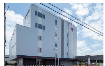
FortiGate 200Eが設置された多摩事業本部

いくつかの製品を比較検討した結果、ここでも、ポット対策も含めた統合的なセキュリティ機能を備えていたFortiGate 200E/80E/60Eを選定することにした。本部やデータセンターでの実績に加え、