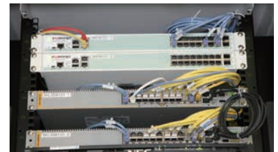
センター病院のサーバーラームに設置されたFortiGate

無線AP(アクセスポイント)を制御できる製品を中心に検討を開始。医療関係の展示会に出展されていたフォーティネットのワイヤレスソリューションの説明を聞いて「双星会の要件に最適」と納得したという。