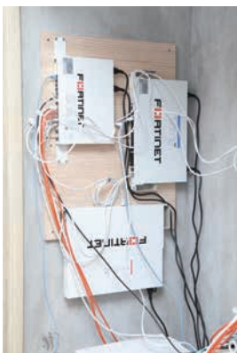
本社内に設置されたFortiGate等の機器

こうした状況を根本的に解決するために盛岡ガスが選択した方法が、FortiGateと、FortiSwitchおよびFortiAPを組み合わせたセキュアSDプランチソリューションを使ったネットワーク環境の全面刷新だった。さ