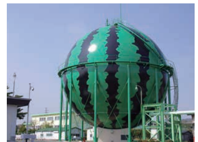
滝沢工場にあるユニークなスイカ柄のガスホルダー