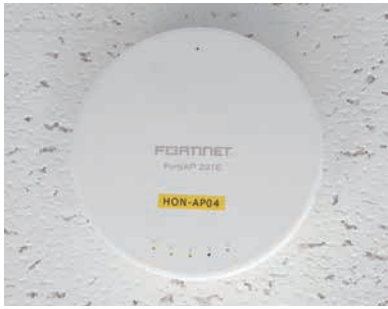
天井に設置されたFortiAP

らにFortiAnalyzerも導入してすべての通信を管理し、ネットワークのどこで何が起きているかを詳細に把握できる環境を目指した。