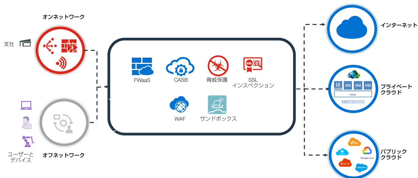
図 1 : SASE ソリューション