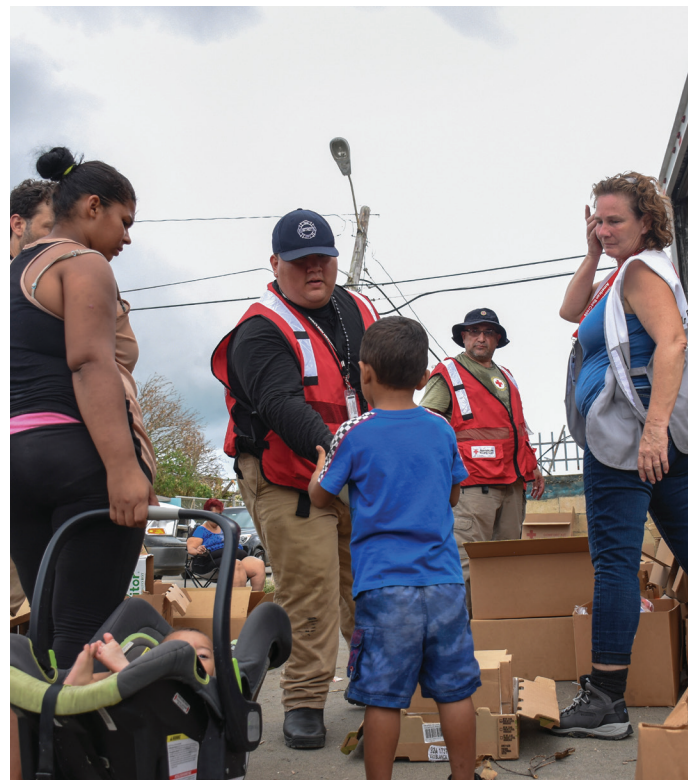
Los voluntarios de la Cruz Roja Americana distribuyen agua, alimentos y otros artículos básicos a familias afectadas por el huracán María.

a los sobrevivientes del huracán María, visite redcross.org/maria .