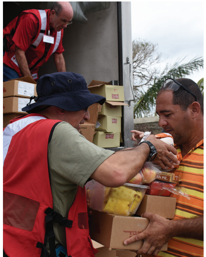
En Barceloneta, Puerto Rico, los voluntarios de la Cruz Roja Americana distribuyen agua, alimentos y otros artículos básicos a familias afectadas por el huracán María.

Junto con alimentos, suministros y acceso a agua potable, la Cruz Roja Americana entregó más de 2,700 generadores solares y de gas para ayudar a los sobrevivientes con afecciones médicas graves. Debido al daño generalizado a la red eléctrica, muchas personas habrían tenido que desechar los medicamentos que requieren refrigeración o no habrían podido utilizar equipos de soporte vital como máquinas de diálisis y oxígeno.