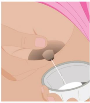
母亲可将奶水从乳房挤入汤匙或瓶子中，并使用汤匙或瓶子喂养患儿。