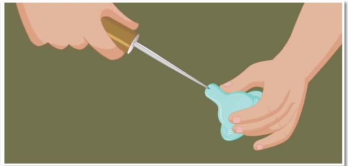
母亲可以稍稍把奶嘴的孔扩大，以增加牛奶的流量。

8 如果没有母乳，母亲可以用牛奶或配方奶粉喂食患儿。确保牛奶和配方奶粉是被煮沸后再冷却的。