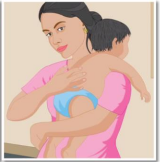
比正常情况更频繁地喂食与拍嗝。