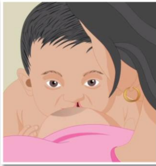
将乳房置于婴儿嘴唇完整的一侧。