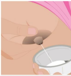
คุณแม่สามารถถ้ายนมจากตนเองเพื่อนำมาใส่ขวดนมโดยการปั๊มนด้วยข้อนหรือขวดนม

7 หากไม่สามารถให้เด็กดื่มนมจากเต้าโดยตรงได้ เรื่องที่สำคัญอย่างยี่งั้นก็คือคุณแม่ต้องให้นมเด็กด้วยวิธีการอื่นๆ ต่อไป ทั้งนี้วิธีการต่างๆ นั้นมีดังนี้: