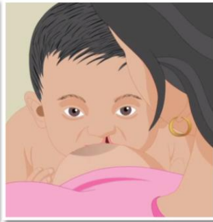
จัดให้หัวนมอยู่ค่อนข้างไปทางฝั่งริมฝีปากปกติของเด็ก