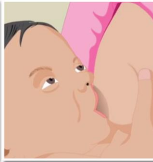
บีบเต้านมเบาๆ เพื่อช่วยให้น้ำนมไหลได้ดียิ่งขึ้น