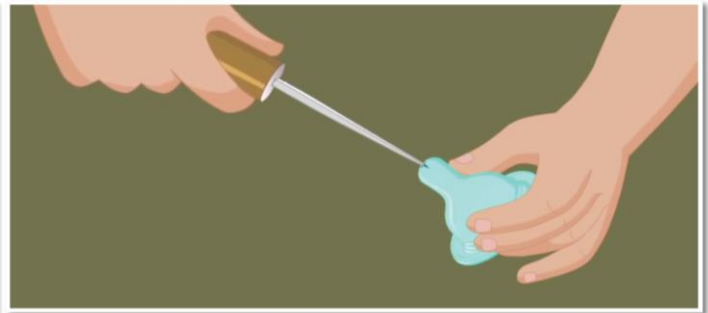
ทั้งนี้อาจขยายช่องที่จุกนมของขวดนมให้กว้างขึ้นอีกเล็กน้อยได้เพื่อทำให้น้ำนมไหลได้ดียิ่งขึ้น

8 หากไม่สามารถให้นมแม่ได้ทั้งหมด คุณแม่ก็สามารถใช้นมวัวหรือนมผง โดยต้องแน่ใจว่าน้ำนมวัวและน้ำสำหรับชงนมนี้ นได้ผ่านการต้มให้เดือดและเย็นแล้ว