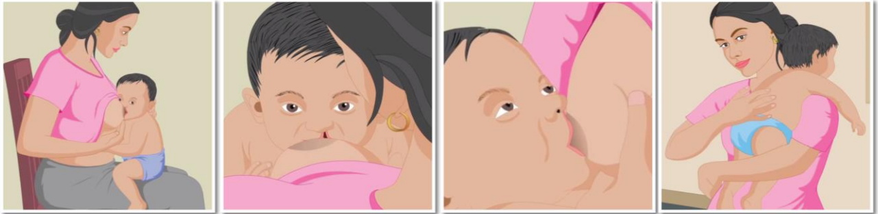
បញ្ជាក់ចំណី ឬបំបៅកូនឱ្យបានឆ្លែតល្អដោយការដាក់ឱ្យអង្គុយក្រុងខ្លួន។ ដាក់តម្រង់ក្បាលដោះបំបៅឱ្យចំកន្លែងដែលគ្មានស្នាមដាច់។ ច្របាច់ដោះថ្មមៗដើម្បីបង្កើនលំហូរ ឬចរន្តទឹកដោះ។ បំបៅ/បញ្ជាក់ចំណី និងបំបៅកូនឱ្យបានញឹកញាប់ជាងប្រក្រតី។

6 ការផ្តល់ចំណីអាហារ ឬបំបៅកូនឱ្យបានឆ្លែតល្អដើម្បីឱ្យពួកគេអាចទទួលបានការរក្សាទុកបាននោះ មានសារៈសំខាន់ណាស់។ ម្តាយត្រូវតែមានការគាំទ្រចំពោះការព្យាយាមប្រើវិធីបញ្ជាក់អាហារ ឬបំបៅផ្សេងៗដើម្បីពិនិត្យតាមដានមើលលើប្រភេទវិធីដែលមានប្រសិទ្ធភាពដល់ខ្លួនឯង និងទារក។ ការបំបៅកូនដោយដោះផ្ទាល់ គឺជាវិធីដ៏ប្រសើរបំផុត ក្នុងករណីដែលអាចធ្វើទៅបាន។ វិធីសាស្ត្រមួយចំនួនមានជាអាទិ៍: