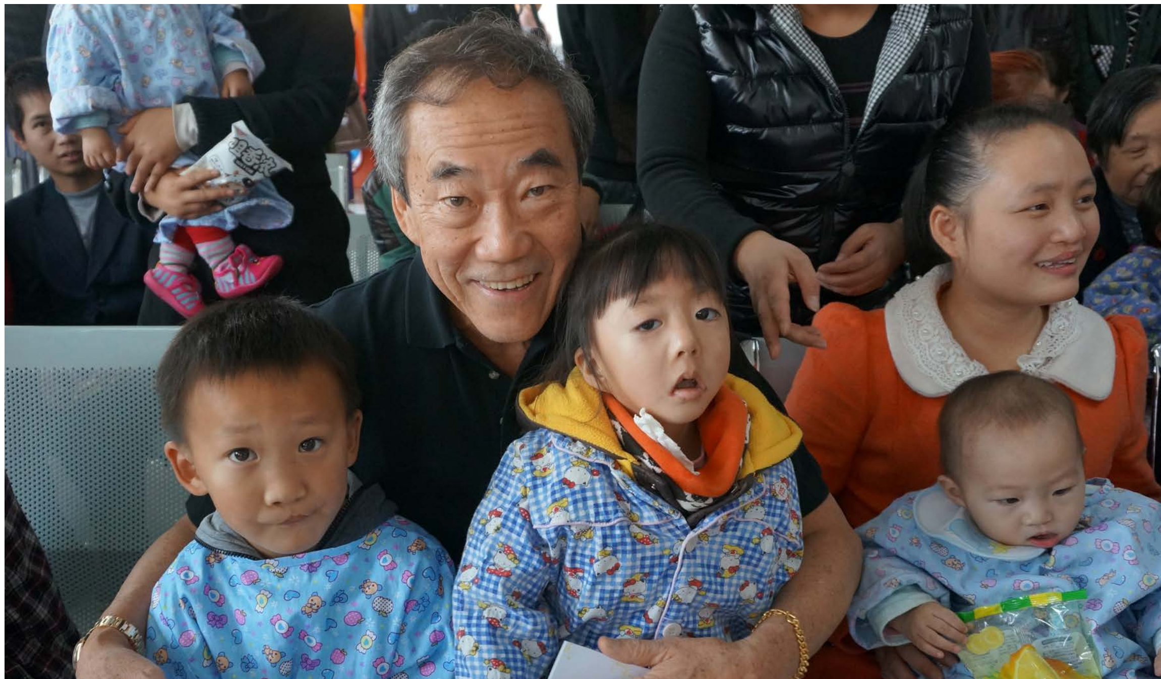
Charles B. Wang, à la rencontre des patients en Chine

Voici l'une de mes photos préférées de notre regretté et bien-aimé fondateur, Charles B. Wang. Il montre si bien à quel point nos patients le remplissaient de chaleur et vous dit tout sur son amour pour cette organisation et pour chacun de ses patients. Mais cela ne fait qu'effleurer la dimension de son dévouement à aider chaque enfant porteur d'une fente à afficher un sourire éclatant.