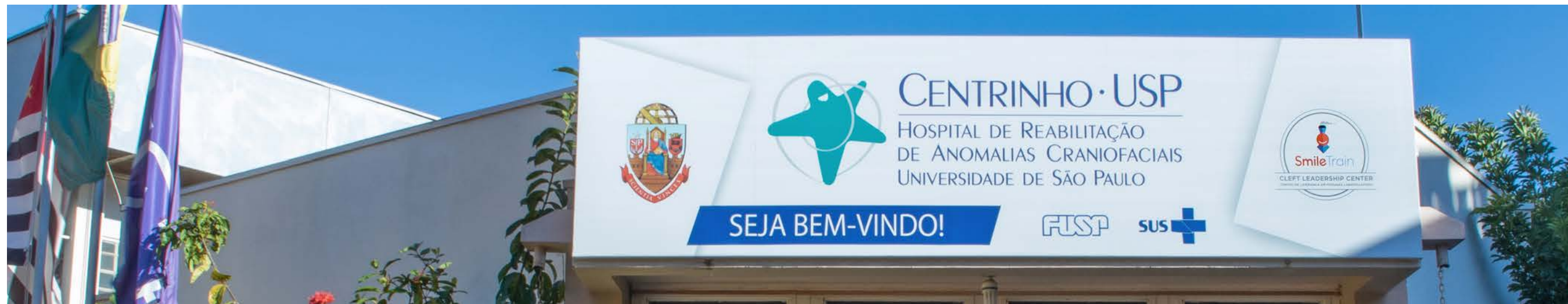
Centre de leadership pour fentes Smile Train HRAC-USP Centrinho Bauru à São Paulo (Brésil)