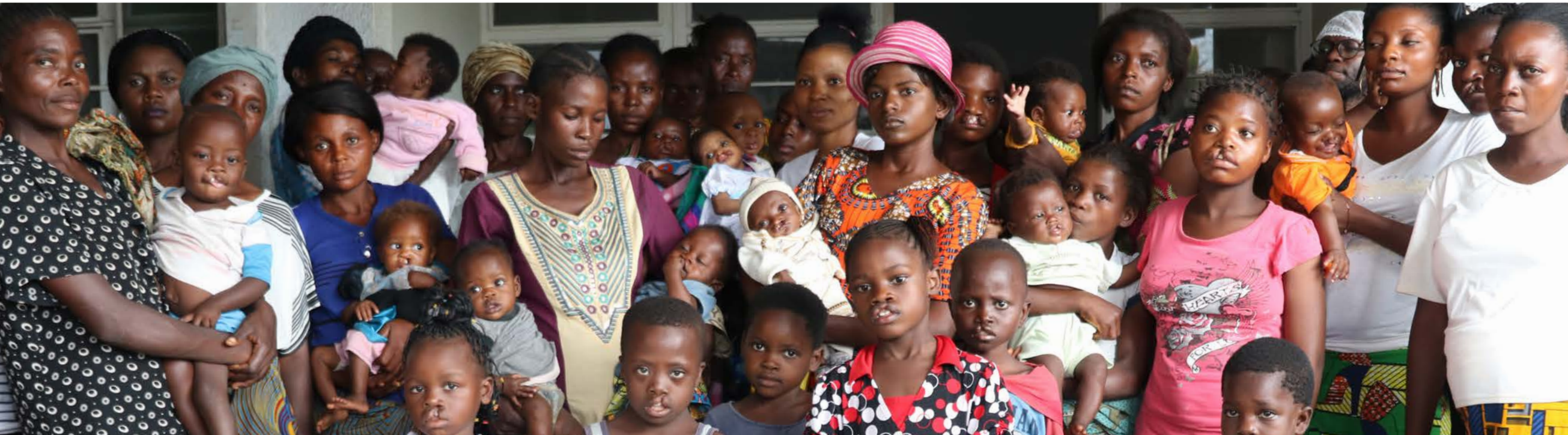
Hopital Général Dipumba, RD Congo

Souvent, les personnes touchées par les fentes, en particulier dans les pays à revenu faible ou intermédiaire, ne sont pas en mesure de peser sur les politiques qui affectent leur vie. Smile Train fait entendre leur voix. Nos représentants font de la sensibilisation aux fentes une priorité mondiale, notamment en plaidant auprès de l'Assemblée mondiale de la santé et de l'Assemblée générale des Nations unies. Les membres de notre personnel régional nouent des relations avec les gouvernements et les partenaires locaux afin de promouvoir les droits des personnes souffrant de fentes labiales, en particulier le droit à des soins de santé sûrs et de qualité qui rendent possibles tant d'autres droits, comme l'éducation et l'indépendance économique.