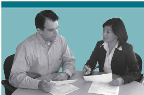
TR-24-ITA (8/15) (retro)

Per saperne di più, usate l'account Online Services o chiamateci al numero (518) 457-5434.