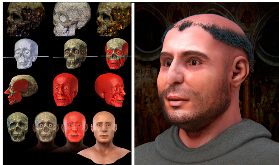
Fig. 4 – Alcune fasi di lavoro della ricostruzione facciale di s. Antonio (a sinistra) affiancate al risultato finale (a destra).

Sant'Antonio, oltre all'indiscutibile impatto emotivo legato alla grande venerazione popolare, offre importanti spunti per verificare i progressi delle