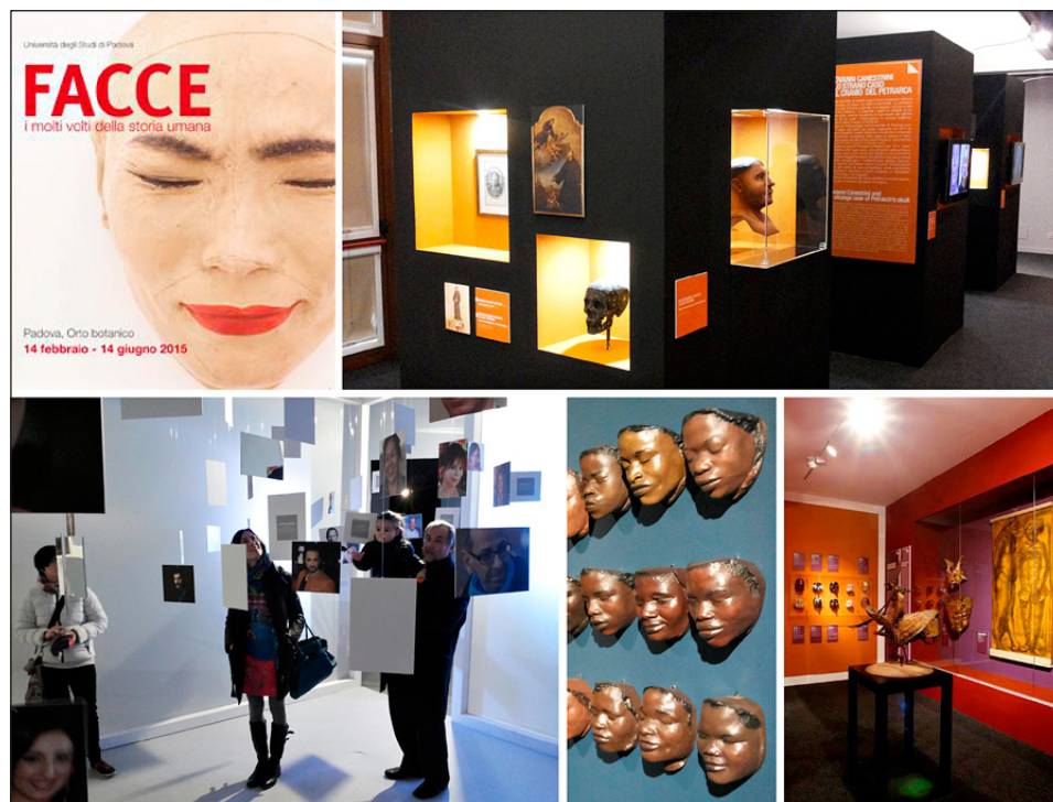
Fig. 1 – Locandina e sale espositive della mostra “FACCE, i molti volti della storia umana”.

Un exhibit interattivo approfondisce l'importanza del riconoscimento dei volti come competenza innata nell'evoluzione, non soltanto umana. Tale installazione si basa su tecnologie di realtà aumentata che, interagendo con i calchi reali dei crani degli ominini, aggiungono più livelli informativi virtuali (muscoli e pelle) ottenuti dalla semplificazione delle ricostruzioni facciali in alta definizione.