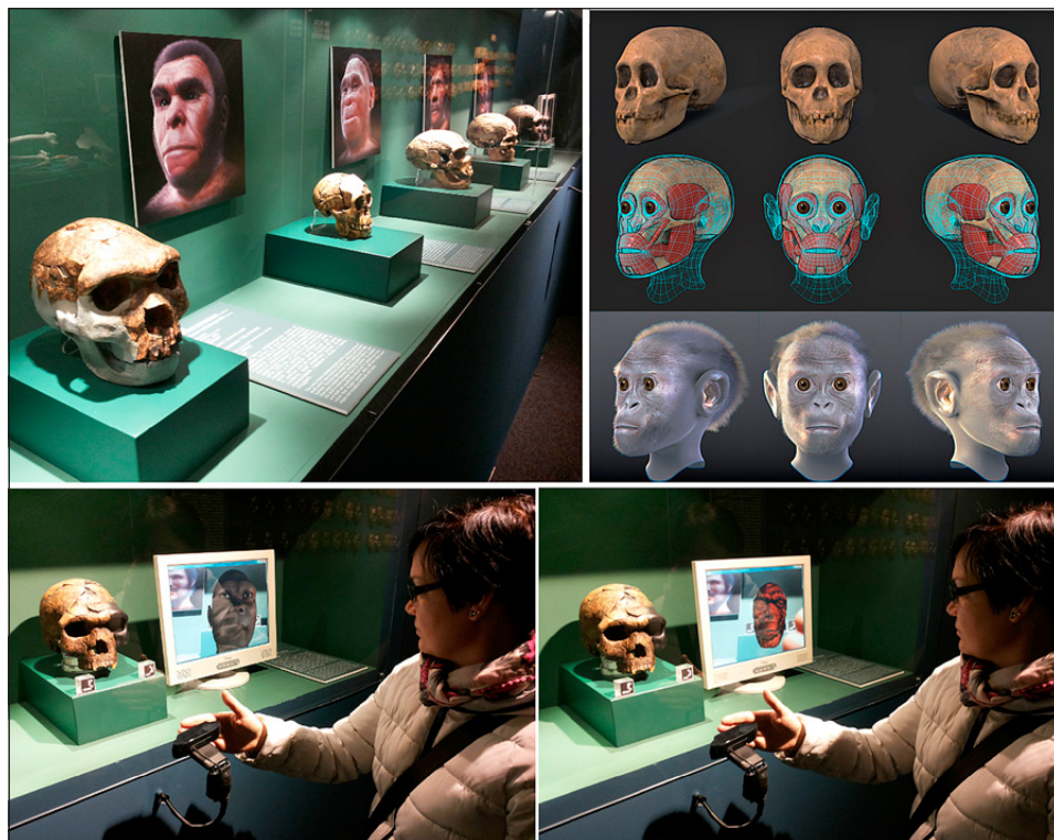
Fig. 2 – L'esposizione con i calchi dei principali ominini fossili (in alto a sinistra); fasi di lavoro della ricostruzione facciale del bambino di Taung (in alto a destra); un esempio di applicazione di realtà aumentata (in basso).