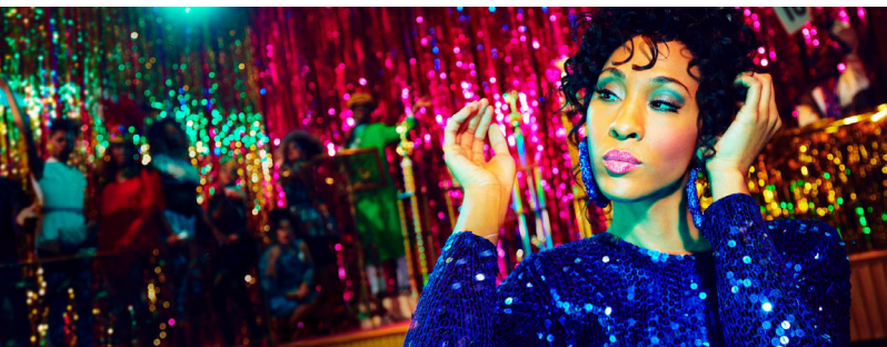
Michaela Jaé Rodríguez en POSE