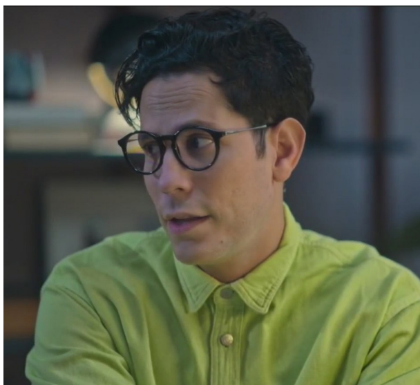
Christian Chávez en LA SUERTE DE LOLI