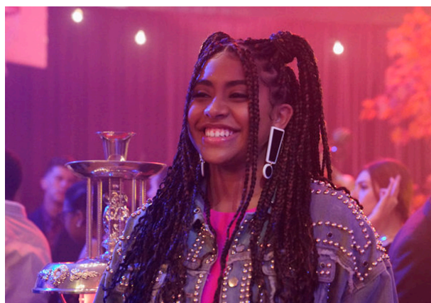
Alycia Pascual-Peña en SAVED BY THE BELL