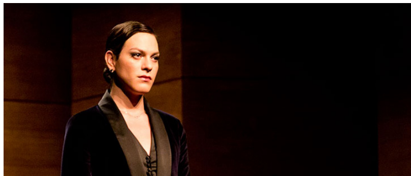
Daniela Vega en A FANTASTIC WOMAN que ganó Mejor Película Internacional en los Premios de la Academia de Artes y Ciencias Cinematográficas, entre otros premios.

¡Entonces empecemos! Y si todavía tienes alguna pregunta, siempre estamos aquí para ayudar. Puedes encontrar nuestra información de contacto en la última página de este documento.