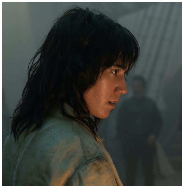
Vico Ortiz en OUR FLAG MEANS DEATH