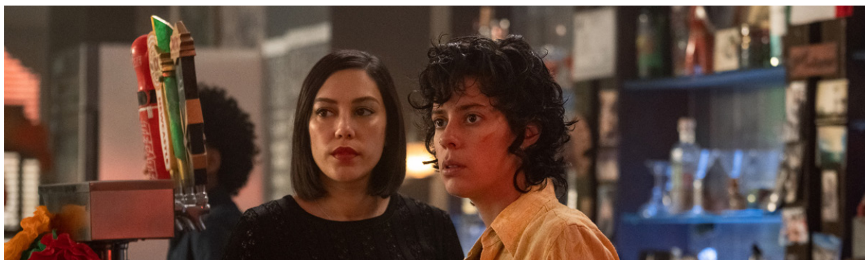
Mishel Prada y Roberta Colindrez en VIDA