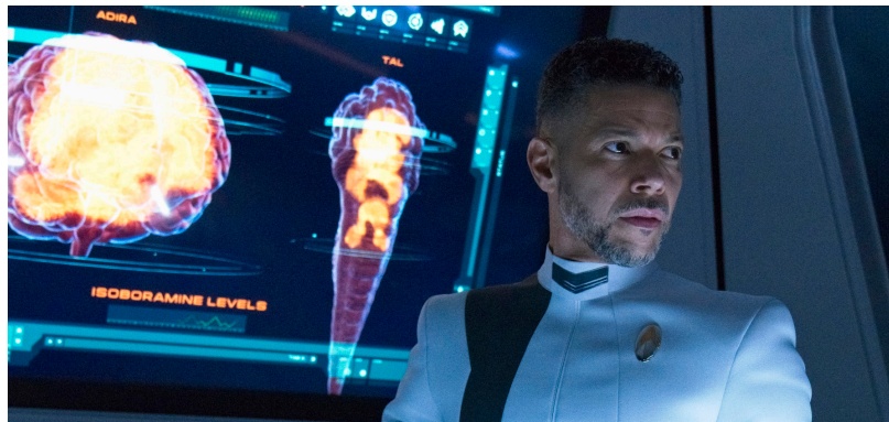
Wilson Cruz en STAR TREK: DISCOVERY