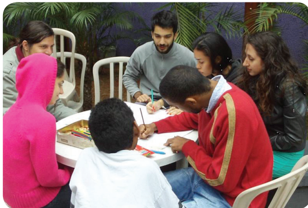
PHOTOS: Capacity building workshop for technical team – São Paulo, February 2014.