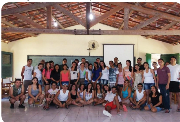
FOTO: Workshop para planejamento pedagógico das Escolas Populares cooperativas – Trairi / Ceará, Setembro de 2013.