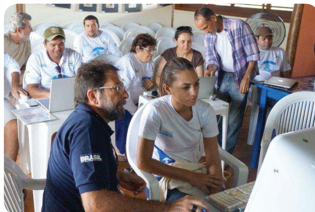
PHOTOS: Staff training around new IT tools to develop communication and marketing materials – March 2014, Ceará.