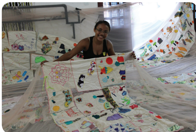
FOTO: Dançarinos criam obras de arte e figurinos de dança no Vidança.