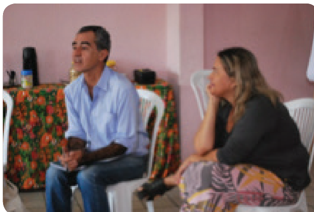
FOTO: Workshop de capacitação para mulheres, com foco no trabalho de equipe.