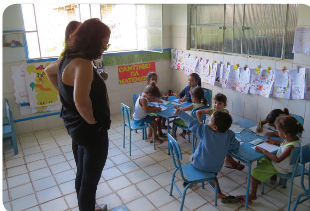
FOTO: Um grupo de 60 crianças brinca participa de atividades no centro.

A maior mudança foi no comportamento das crianças: elas se tornaram mais amigas, com participação ativa, respeito, empatia e generosidade.