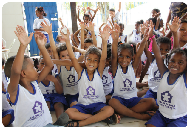
FOTO: Crianças durante atividades educativas do centro.

O reconhecimento e a credibilidade que este apoio deu à eles, tornou possível a consolidação e o reforço de processos institucionais, e com isso, a creche aproveitou para rever sua abordagem pedagógica, movendo-se para entender o seu papel, e os funcionários passaram de meros cuidadores a verdadeiros educadores. Atualmente, eles são capazes de influenciar profundamente a vida das crianças e adolescentes que estão sob os seus cuidados.