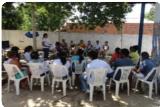
FOTO: Reunião de grupo com pais e funcionários