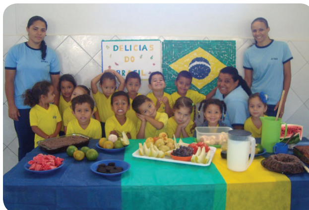
FOTO: Crianças e educadores no café da manhã.

A doação contribuiu para uma melhor nutrição de 130 crianças, através da aquisição de uma grande variedade de frutas, vegetais e carnes, influenciando positivamente o estado nutricional; e também adquirindo mais ferramentas metodológicas como games e brinquedos, usados no progresso educacional.