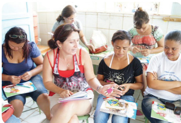
PHOTOS: Pedagogical material for teacher’s capacity building.

Os funcionários perceberam melhoria no trabalho de equipe. Essas mudanças, ainda que sutis, foram percebidas no cuidado que a equipe teve nas suas interações com as crianças, através de reflexões e percepções das famílias com seus filhos; e através da equipe em si, incorporando novas formas de trabalhar e pensar.