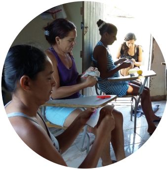
Aproarti Icó, CE

Fighting violence and discrimination against women in Salvador's suburbs // Combate à violência e discriminação contra mulheres do subúrbio ferroviário de Salvador