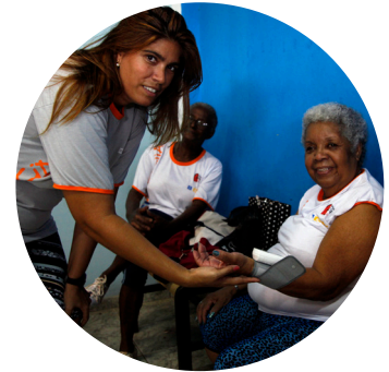
Casa de Santa Ana Cidade de Deus, RJ

Training women to make small home repairs to improve their housing conditions // Capacitação de mulheres para melhorarem as condições de suas próprias moradias com pequenas reformas