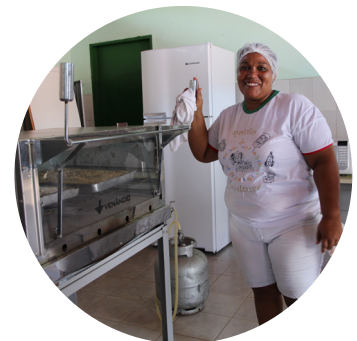
Centro Comunitário Sociocultural de Barra dos Coqueiros Aracaju, SE

Strengthening and promoting awareness for the Maria da Pena law // Fortalecimento e valorização da Lei Maria da Penha