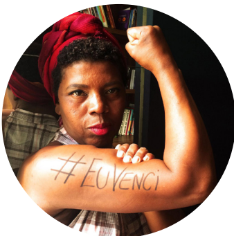
Arte de Viver Bem São Paulo, SP

Training caretakers of the elderly // Capacitação para formação de cuidadoras de idosos