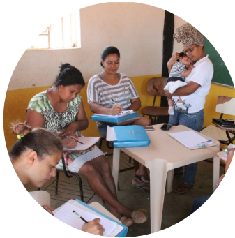
Associação dos Arquitetos Sem Fronteiras Belo Horizonte, MG

Income generation for women in Ceará's semi-arid // Geração de renda para mulheres no sertão cearense