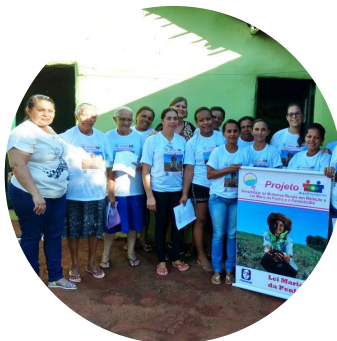
Centro de Mulheres Urbanas e Rurais de Lagoa do Carro e Carpina Lagoa do Carro, PE

Improving quality of life for women undergoing treatment for breast cancer // Melhoria da qualidade de vida para mulheres em tratamento de câncer de mama