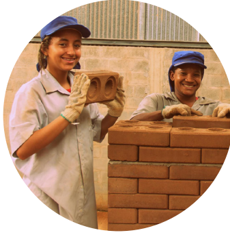
Associação Ateliê de Ideias Vitória, ES

Financial support and training for women to build their own houses // Finanças solidárias e capacitação de mulheres para construção de suas próprias casas