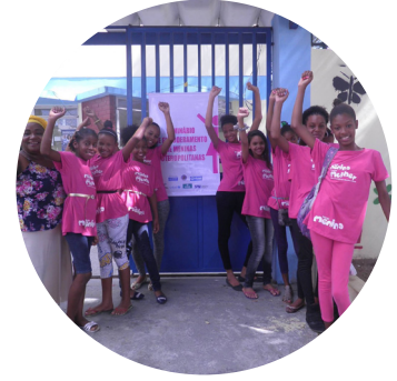
Associação Renascer Mulher Salvador, BA

Financial support and training for women to build their own houses // Finanças solidárias e capacitação de mulheres para construção de suas próprias casas