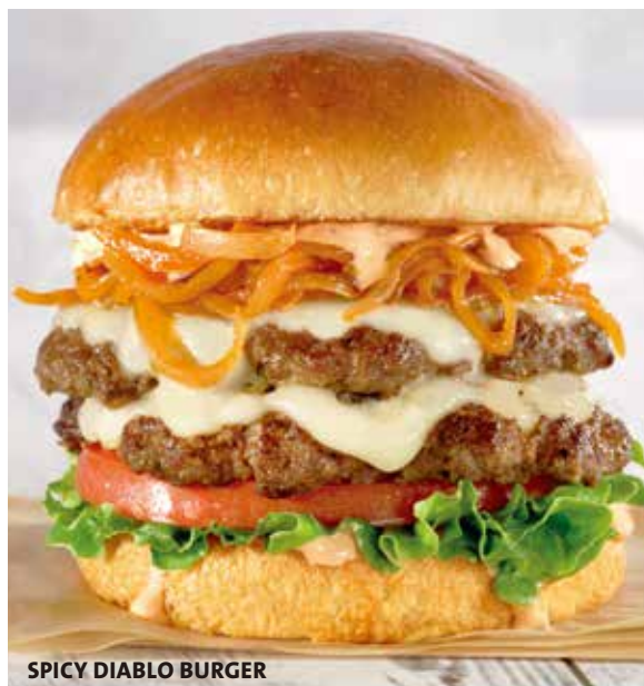
SPICY DIABLO BURGER