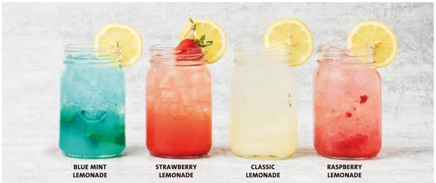
BLUE MINT LEMONADE