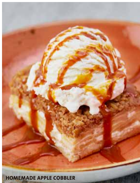
HOMEMADE APPLE COBBLER

ブラウニー、アップルコブラー、チーズケーキの三種類を一度に楽しめる贅沢で欲張りでロックな一皿です。