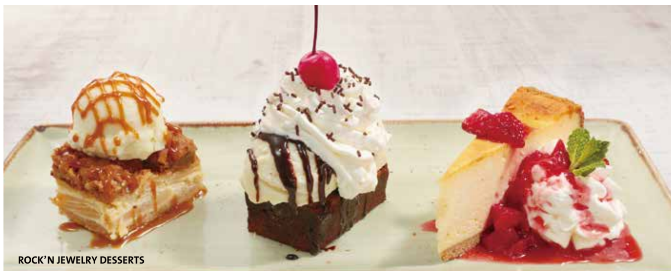
ROCK 'N' JEWELRY DESSERTS

Prices include tax. 10% service charge will be added.