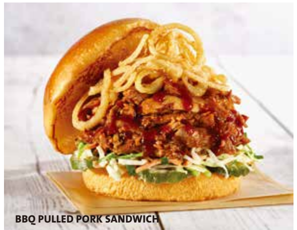
BBQ PULLED PORK SANDWICH

Hand-pulled smoked pork with our house-made barbecue sauce, served on a fresh toasted bun with coleslaw, pickles and shoestring onions. 細かく裂いたポークにBBQソースで味付けしたサンドイッチ。