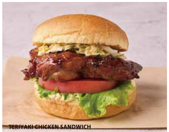
TERIYAKI CHICKEN SANDWICH

Grilled boneless chicken leg with leaf lettuce, vine-ripened tomato, cole-slaw, original teriyaki sauce and wasabi mayonnaise. 照り焼きチキン、ワサビマヨネーズ、リーフレタス、トマト、コールスロー。