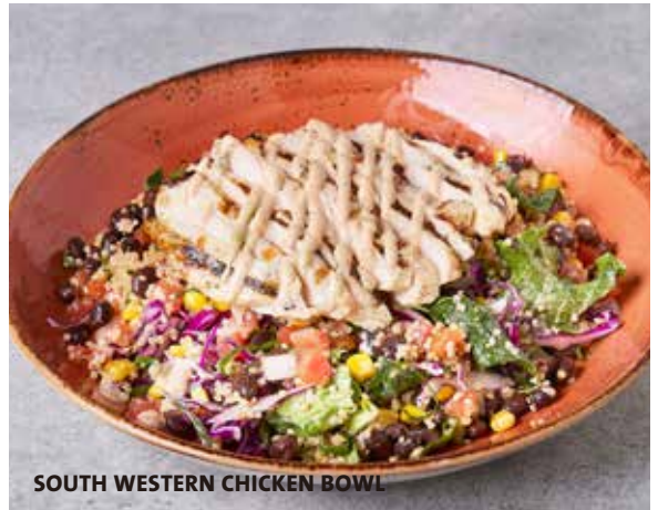
SOUTH WESTERN CHICKEN BOWL

新鮮なグリーン野菜をワカモレランチドレッシングで和え、スパイシーに焼き上げたチキン、赤キャベツ、ピコデガロ、キヌアコンサラダ、ブラックビーンズミックスをトッピング。