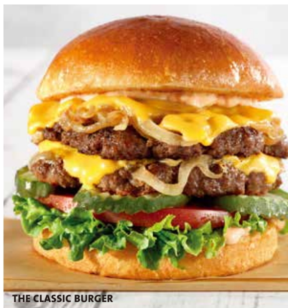
THE CLASSIC BURGER