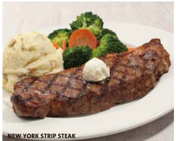
NEW YORK STRIP STEAK