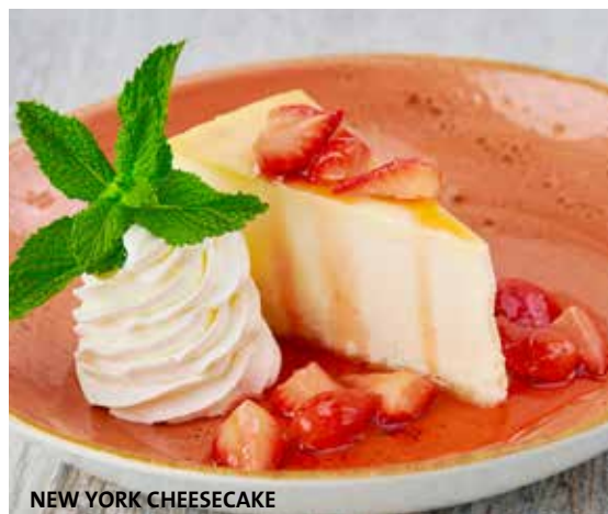
NEW YORK CHEESECAKE

クリーミーで豊かな味わいのニューヨークスタイルチーズケーキにストロベリーソースをトッピング。ホイップクリーム添え。