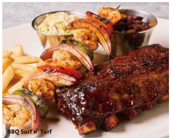
BBQ Surf n' Turf

BBQ RIBS & PULLED PORK BBQ リブ&プルドポーク ¥4,380-