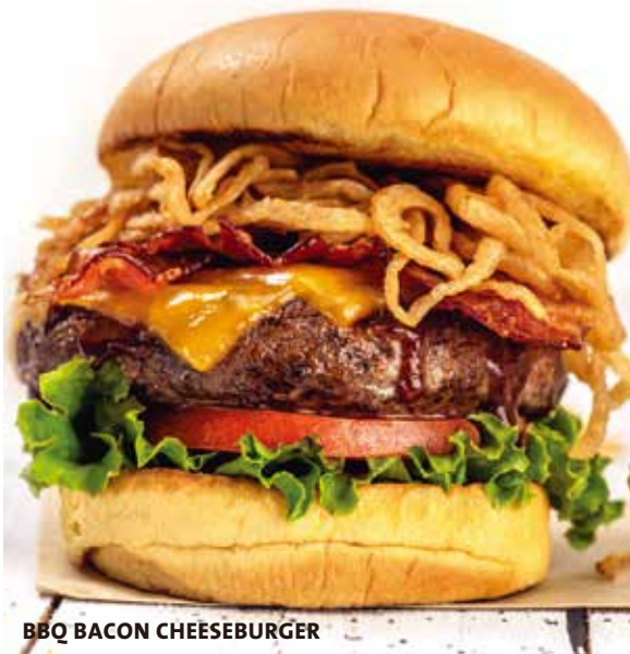
BBQ BACON CHEESEBURGER

A hand-made black bean, corn and quinoa veggie burger topped with grilled pineapple, barbeque sauce, Monterey Jack cheese, crispy shoestring onion, served on a toasted bun with a spicy slaw.† ブラックビーン、キヌア、コーンパテ、モンテレージャックチーズ、BBQパイナップル、コールスロー、フライドオニオン