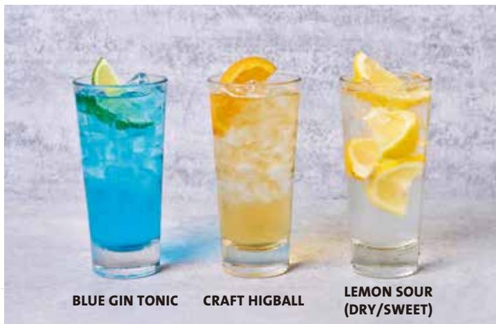
BLUE GIN TONIC

ブラックベリースパークリングサングリア A signature blend of red wine, the fresh flavors of blackberries, cranberry and squeeze of orange, topped with sparkling wine. 赤ワインとクランベリーを使い、スパークリングワインで仕上げたサングリア。