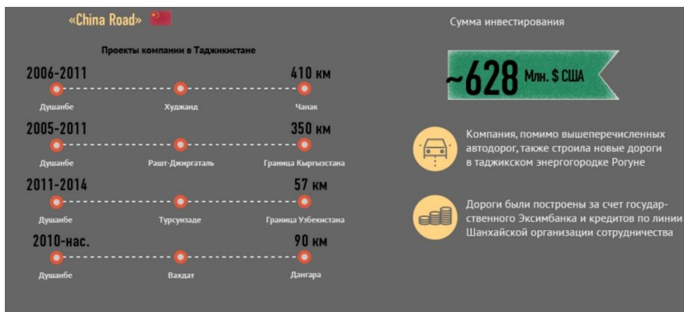
Рисунок 2. Китайские проекты по строительству автомобильных дорог в Таджикистане 11 .

В сфере услуг Таджикистан возлагает большие надежды на туризм, для развития которого обладает положительными факторами – природными, климатическими, историческими и демографическими особенностями, а также национальными традициями гостеприимства. Правительство республики в Концепции развития туризма на 2009–2019 гг. ставила задачу – добиться ежегодного привлечения более 1 млн туристов в страну до 2020 г. Она была достигнута в 2019 году, когда, по данным Комитета по развитию туризма при Правительстве Республики Таджикистан, страну посетило 1,2 млн. туристов. По словам главы упомянутого комитета Ш.Амонзода, доход от туризма в экономику Таджикистана составил $267,5 млн за счет продажи билетов, а за счет оказания туристических услуг казна республики получила около 41,7 млн долларов США 12 . Пандемия коронавируса может сильно ударить по этой части доходной статьи бюджета Таджикистана. По подсчетам аналитиков Всемирного банка, в Таджикистане каждый турист в течение 6-12 дней своего пребывания тратит в среднем 800-1400 долларов 13 . Если полагаться на достоверность этих данных, то из-за коронавирусного