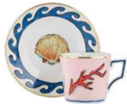
SET DI 2 TAZZE CAFFÈ CON PIATTINO COFFEE CUPS & SAUCERS - SET OF 2