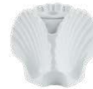
VASO / PORTACANDELA A 3 CONCHIGLIE H 8,5 CM - WHITE 3 SHELLS VASE / CANDLEHOLDER H 8,5 CM - WHITE