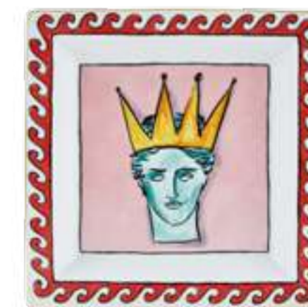
SVUOTATASCHE QUADRATO CM 24,5 - PINK SQUARED VIDE POCHE CM 24,5 - PINK