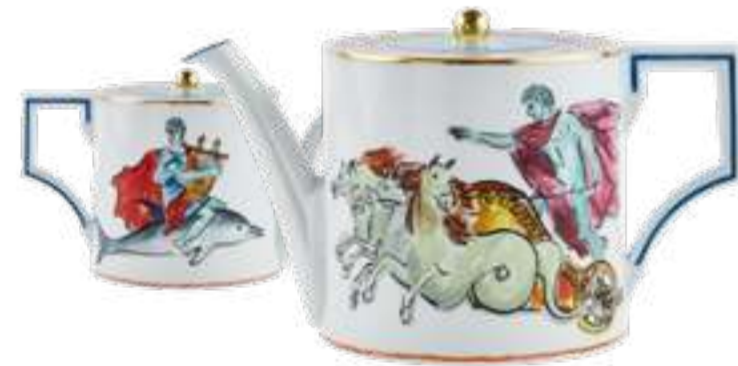
TEIERA LT 1,2 - WHITE TEAPOT LT 1,2 - WHITE