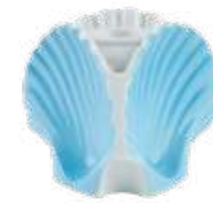
VASO / PORTACANDELA A 3 CONCHIGLIE H 8,5 CM - SEA BLUE 3 SHELLS VASE / CANDLEHOLDER H 8,5 CM - SEA BLUE