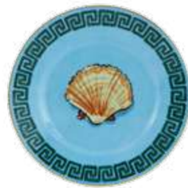
PIATTO PANE CM 16 - SEA BLUE BREAD PLATE CM 16 - SEA BLUE