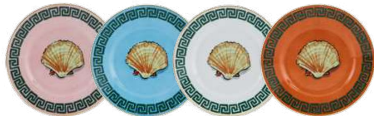
MIX DI 4 PIATTI PANE CM 16 MIX OF 4 BREAD PLATES CM 16