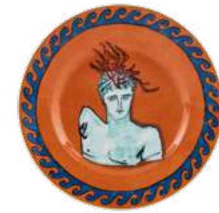
PIATTO DESSERT CM 22 - ROCK ORANGE DESSERT PLATE CM 22 - ROCK ORANGE