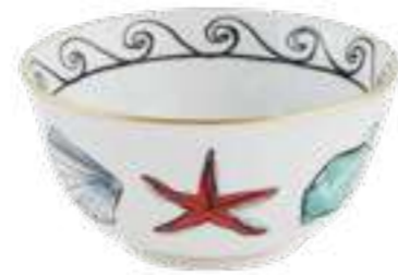
COPPETTA CM 11 - WHITE BOWL CM 11 - WHITE