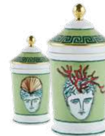
VASO FARMACIA H 20 CM - MOSS GREEN PHARMACY VASE H 20 CM - MOSS GREEN