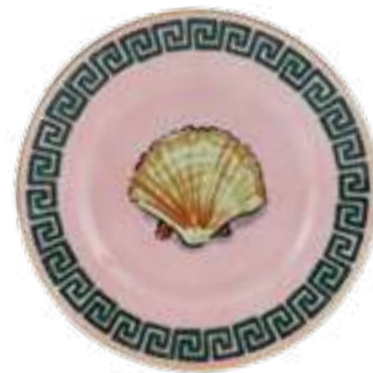
PIATTO PANE CM 16 - PINK BREAD PLATE CM 16 - PINK