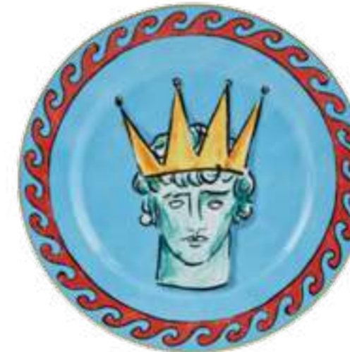
PIATTO PIANO CM 28 - SEA BLUE FLAT DINNER PLATE CM 28 - SEA BLUE