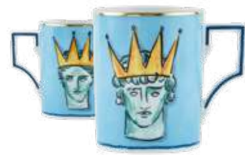
MUG CC 400 - SEA BLUE MUG CC 400 - SEA BLUE