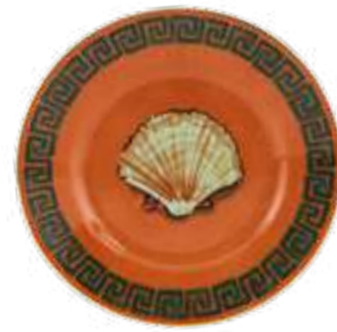
PIATTO PANE CM 16 - ROCK ORANGE BREAD PLATE CM 16 - ROCK ORANGE