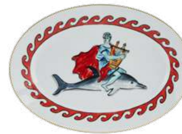
VASSOIO OVALE PIANO CM 34 - DOLPHIN WHITE OVAL FLAT PLATTER CM 34 - DOLPHIN WHITE