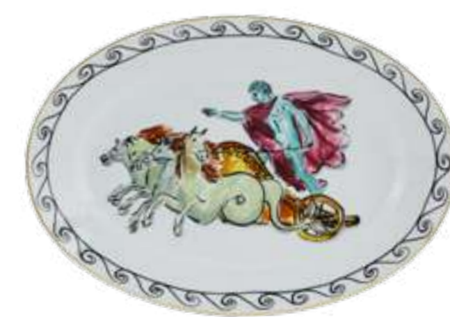
VASSOIO OVALE PIANO CM 34 - CHARIOT WHITE OVAL FLAT PLATTER CM 34 - CHARIOT WHITE