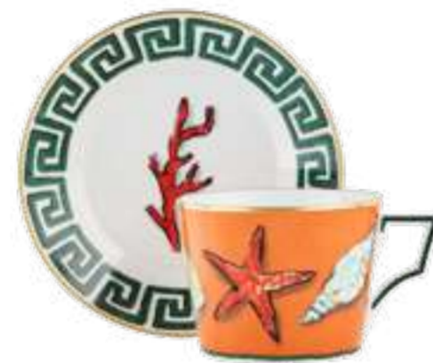
SET DI 2 TAZZE TÈ CON PIATTINO TEA CUPS & SAUCERS - SET OF 2