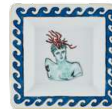
SVUOTATASCHE QUADRATO CM 18 - WHITE SQUARED VIDE POCHE CM 18 - WHITE