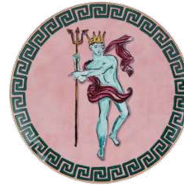
CENTROTAVOLA E SEGNAPOSTO CM 33 - PINK CENTERPIECE AND CHARGER PLATE CM 33 - PINK