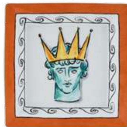
SVUOTATASCHE QUADRATO CM 24,5 - ROCK ORANGE SQUARED VIDE POCHE CM 24,5 - ROCK ORANGE