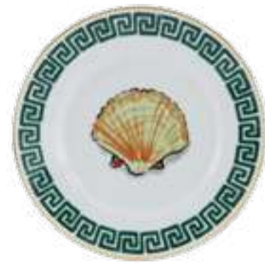
PIATTO PANE CM 16 - WHITE BREAD PLATE CM 16 - WHITE