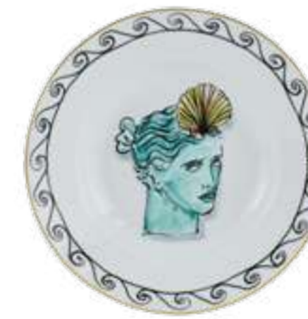
PIATTO FONDO CM 24,5 - WHITE SOUP PLATE CM 24,5 - WHITE