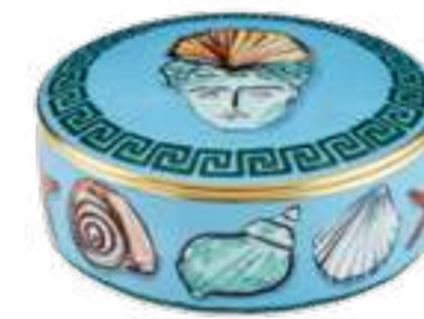
SCATOLA ROTONDA CM 13 - SEA BLUE ROUND BOX CM 13 - SEA BLUE