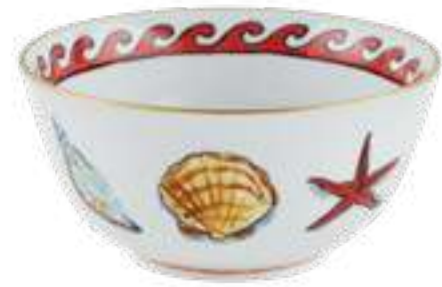
CALOTTA CM 17 - WHITE BOWL CM 17 - WHITE