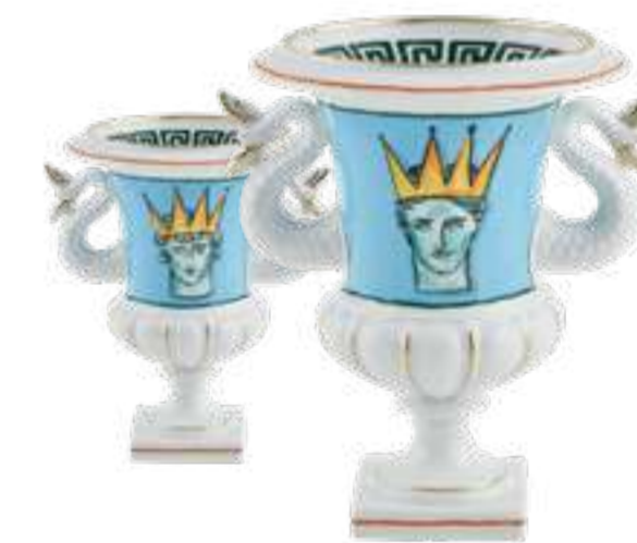
VASO MEDICEO CON CODE DI SIRENA H 21,5 CM - SEA BLUE MEDICEO VASE WITH MERMAID TAILS H 21,5 CM - SEA BLUE