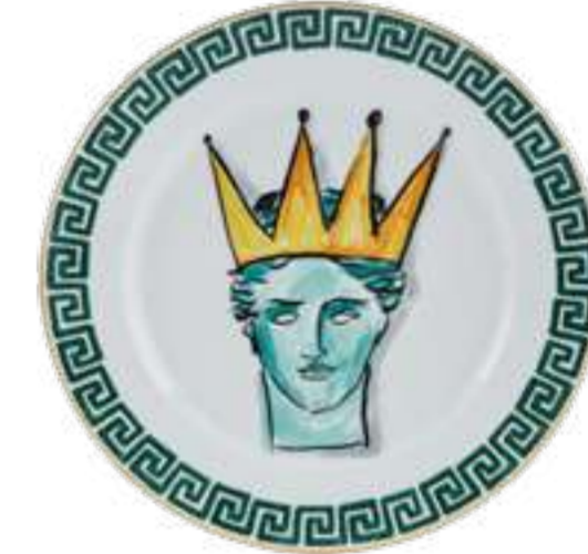
PIATTO PIANO CM 28 - WHITE FLAT DINNER PLATE CM 28 - WHITE