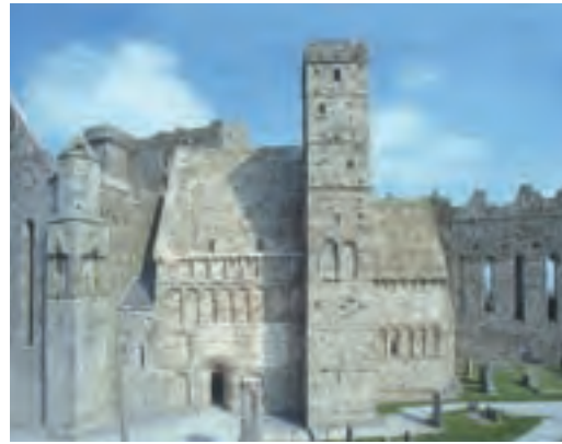
Chapelle de Cormac

Une réplique de la croix de Saint-Patrick, datée du 12ème siècle, trône entre la cathédrale et la grande salle de la Chorale des vicaires. La croix originale est aujourd'hui exposée dans la crypte de la Chorale des vicaires. Elle se distingue des autres croix celtiques irlandaises par sa tête non cerclée et par la présence de supports latéraux, même si une seule d'entre elles subsiste aujourd'hui. Comme la plupart des croix celtiques du 12ème siècle, elle porte d'un côté une représentation du Christ vêtu d'une longue tunique. De l'autre côté, on trouve la représentation d'un évêque ou d'un abbé. Il a souvent été avancé que sa base était la pierre inaugurale des rois de Cashel, ce qui est fort improbable. Il apparaît très nettement que la pierre de base a été choisie, extraite et taillée en même temps que la croix.