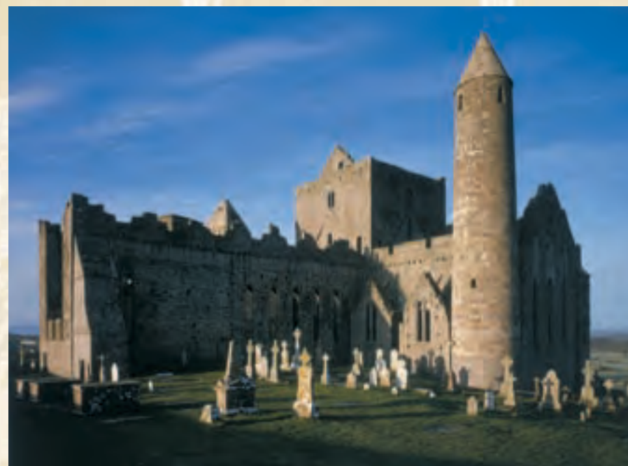
Ci-dessus : la tour ronde et la cathédrale, vue du côté nord est En arrière-plan : fenêtres du chœur de la cathédrale