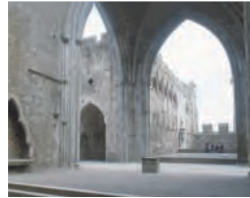
Nef et chœur de la cathédrale

La cathédrale est une grande église gothique en forme de croix, sans allée, bâtie entre 1230 et 1270. Une tour du 15ème siècle s'élève à la croisée entre l'église et les transepts. La cathédrale fut assez grossièrement implantée entre trois sites antérieurs : la tour ronde, la chapelle de Cormac et un puits taillé dans la roche. De nombreuses têtes en pierre, aux dessins très variés, furent disposées sur les chapiteaux, les arrêts de reféteau et les encorbellements situés à l'intérieur et à l'extérieur de l'édifice.