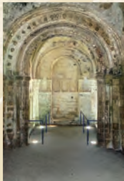
Intérieur de la chapelle de Cormac