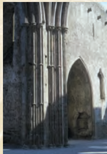
Pilier de la croisée et chapelle du transept, cathédrale