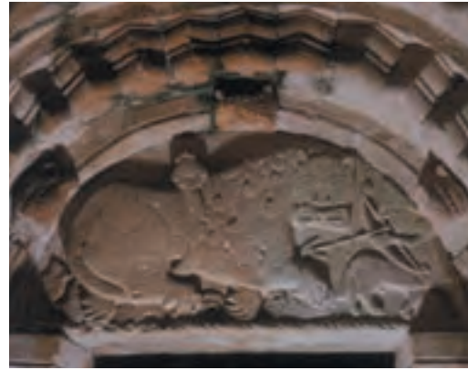
Tympan sur la porte nord de la chapelle de Cormac

La porte sud est moins impressionnante que la porte principale située côté nord, qui est à la fois plus grande et davantage ornementée. Le tympan sculpté qui surmonte la porte nord représente la chasse à l'arc d'un gros lion par un petit centaure (mi-homme, mi-cheval), ainsi qu'un casque de type normand. Aujourd'hui entourée par les murs de la cathédrale, cette entrée donnait initialement sur la campagne environnante.