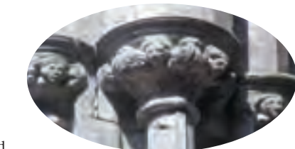
À droite : têtes sculptées sur chapiteaux, 13ème siècle

Cashel aurait possédé une église ou une cathédrale d'assez grande taille peu après 1101 et plus vraisemblablement vers 1111. Elle se tenait probablement vers l'extrémité est du chœur de la cathédrale érigée au 13ème siècle. En 1119, les Mac Cárthaigh, une branche des Eóganacht installée à Desmond (Sud Munster),