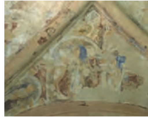
Peinture du 12ème siècle, plafond du chœur de la chapelle de Cormac

Le chœur est presque carré, avec à son extrémité est un renforcement faisant saillie à l'extérieur et abritant l'autel. Curiosité de la chapelle : le chœur est excentré par rapport à la nef. L'arc triomphal, de quatre ordres, possède des piliers et des chapiteaux finement ciselés. Le second ordre en partant de l'extérieur comporte une série remarquable de têtes en pierre apposées sur les piliers et l'arche.