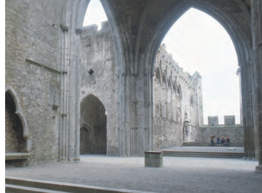
Hauptschiff und Chor der Kathedrale

Die Kathedrale ist eine große gotische Kreuzkirche ohne Seitenschiffe, die zwischen 1230 und 1270 erbaut wurde. Über der Vierung zwischen der Kirche und den Querschiffen erhebt sich ein Turm aus dem 15. Jahrhundert. Die Kathedrale wurde ohne große Rücksichtnahme zwischen drei vorhandene Bauwerke eingefügt: den Rundturm, die Cormac's Chapel und einen aus einem Felsen gehauenen Schacht. Sowohl innen als auch außen am Gebäude findet sich eine umfangreiche und vielfältige Sammlung von Steinköpfen auf Kapitellen, Gesimsanschlügen und Kragsteinen.