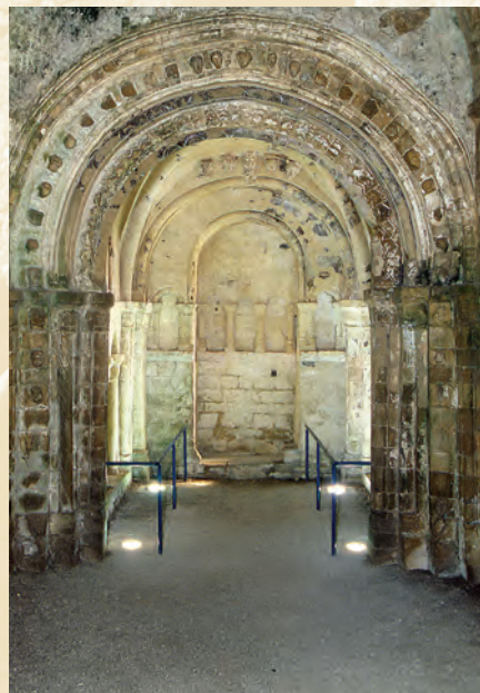
Innenansicht der Cormac's Chapel