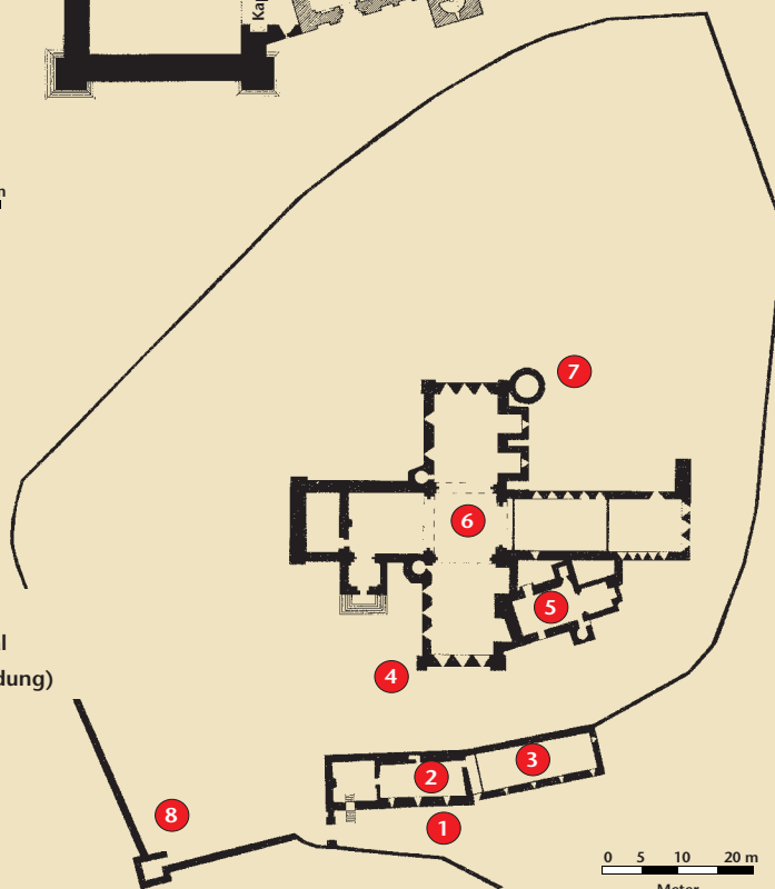
0 5 10 20 m Meter