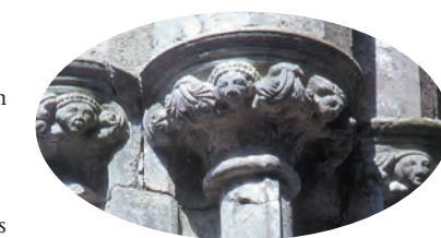
Rechts: Gemeißelte Köpfe auf Kapitellen aus dem 13. Jahrhunderts

Diese stand wahrscheinlich dort, wo sich das östliche Ende des Chors der