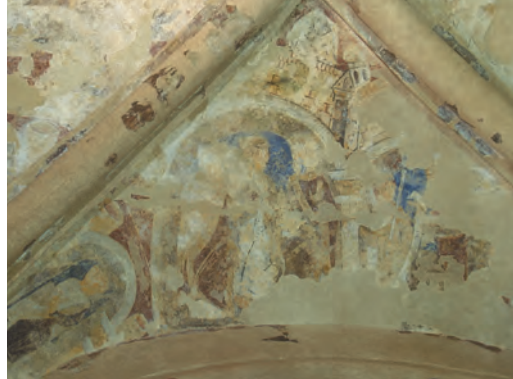
Malerei aus dem 12. Jahrhundert an der Decke des Altarraums der Cormac's Chapel

Der Altarraum hat einen fast quadratischen Grundriss mit einer nach außen vorstehenden Altarnische an seinem östlichen Ende. Ein rätselhaftes Merkmal der Kapelle ist, dass der Altarraum nicht genau mit dem Hauptschiff ausgerichtet ist. Der Bogen des Altarraums mit vier Säulen besitzt fein gemeißelte Sockel und Kapitelle. Die zweite Säule von außen besitzt eine bemerkenswerte Reihe von Steinköpfen auf den Sockeln und dem Bogen. Auf den Rundleisten