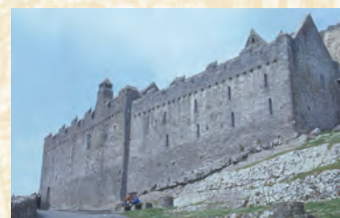
Rechts: Halle und Schlafsaal des Vicar's Choral (Südansicht) Hintergrund: Chorfenster der Kathedrale

Im oberen Geschoss befand sich der Hauptaufenthaltsraum des Vicar's Choral mit einer großen Feuerstelle in der Südwand. Dieser Raum wurde mit einer Empore aus Holz an seinem westlichen Ende wiederhergestellt. Die gewölbte Krypta unter der Halle birgt eine Sammlung von Steinskulpturen, von denen die meisten vom Felsen selbst stammen. Dort ist auch das St. Patrick's Cross untergebracht, um es vor Witterungsschäden zu schützen.