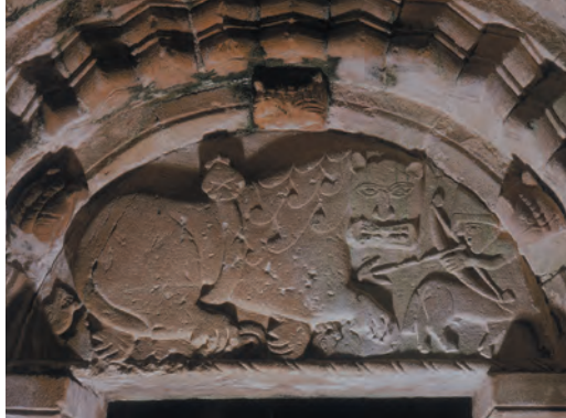
Tympanon über dem Nordeingang der Cormac's Chapel

Das Südtor ist nicht so eindrucksvoll wie das größere und stärker verzierte ursprüngliche Haupteingangstor an der Nordseite des Gebäudes. Das gemeißelte Tympanon über dem Nordtor zeigt einen großen Löwen, der von einem kleinen Zentaur (halb Mensch, halb Pferd), der einen normannischen Helm trägt, mit Pfeil und Bogen gejagt wird. Heute eingefasst von den Mauern der Kathedrale, führte dieser