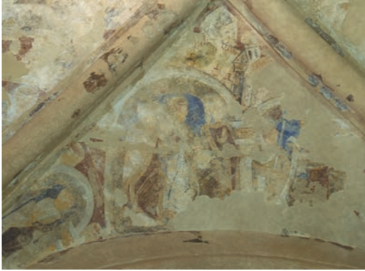
Dipinto del XII secolo sulla volta del presbiterio della Cormac's Chapel

Il presbiterio ha pianta quasi quadrata con una nicchia per l'altare sporgente all'esterno all'estremità est. Una caratteristica curiosa della cappella è il posizionamento del presbiterio, decentrato rispetto alla navata. L'arco del presbiterio, a quattro ordini, presenta pilastri e capitelli finemente scolpiti. Il secondo ordine dall'esterno è dotato di una pregevole serie di teste di pietra sui pilastri