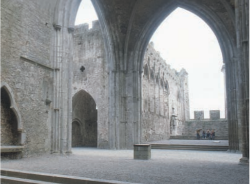
Navata e coro della cattedral

L'alto altare era posizionato all'estremità orientale del coro. Solo la parte inferiore del timpano orientale, con la sezione inferiore della finestra trifora a est, è sopravvissuta. La serie di alte e strette finestre a sesto acuto delle pareti nord e sud sono coerenti in un edificio che è datato intorno al 1230. Tra le cime di tali finestre di trovano piccole finestre a quadrifoglio. La pietra scolpita originale nel coro è in arenaria, in contrasto con la pietra calcarea usata per le sculture più raffinate nella parte restante e successiva dell'edificio. Nella parete meridionale, a partire dall'estremità a est, si trovano la piscina (una nicchia con un bacino e uno scarico in pietra, dove venivano lavati i recipienti sacri), la sedilia danneggiata (dove i celebranti sedevano in alcuni momenti della Messa) e la tomba a parete del famigerato Miler Magrath, Arcivescovo protestante di Cashel dal 1570 al 1622.