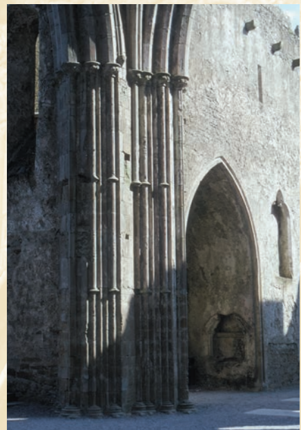
Pilastro dell'intersezione e della cappella del transetto, cattedrale