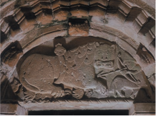
Timpano sull'entrata nord alla Cormac's Chapel

La porta a sud non è d'impatto come la porta d'ingresso originale principale, più grande e ornata, situata sul lato settentrionale dell'edificio. Il timpano scolpito sopra questa porta a nord mostra un imponente leone cacciato da un piccolo centauro (metà uomo e metà cavallo) con un arco e una freccia e con indosso un elmo normanno. Ora integrata nelle pareti della cattedrale, un tempo questo ingresso si affacciava su uno spazio aperto.