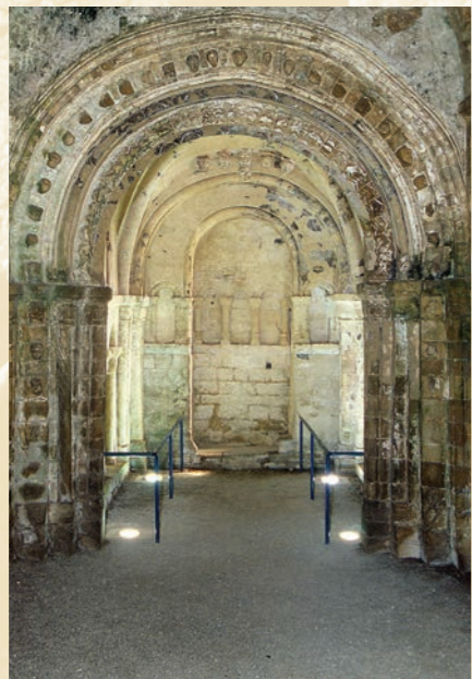
Interno della Cormac's Chapel