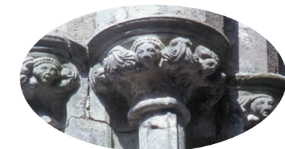
A destra: teste scolpite su capitelli del XIII secolo

Poco dopo il 1101, e certamente nel 1111, Cashel doveva già avere una chiesa molto grande o una cattedrale, probabilmente eretta sul sito all'estremità destra del coro della cattedrale del XIII secolo. Nel 1119 un ramo degli Eóganacht, soprannominati Mac Cárthaigh e stanziati a Desmond (sud Munster), riconquistò un certo potere e influenza a Cashel. Fu così che Cormac Mac Cárthaigh, re di