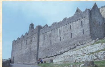
A destra: la hall of Vicars Choral e il suo dormitorio da sud. Sfondo: finestre del coro della cattedrale

A sud della cattedrale, in cima a una ripida strada di accesso al sito, si trova un lungo edificio a due piani. All'inizio del XV secolo, l'Arcivescovo O'Hedian costruì la sala, e successivamente il dormitorio a est, per ospitare il Vicars Choral un gruppo di uomini sia laici che religiosi, addetti a cantare durante le funzioni. Il livello superiore comprendeva il salotto principale del Vicars Choral, con un grande caminetto nella parete meridionale. La sala è stata ristrutturata con una galleria in legno all'estremità occidentale. La cripta a volta sotto la sala contiene una collezione di sculture in pietra, prevalentemente provenienti dalla Rocca. La Croce di San Patrizio originale si trova qui, affinché sia protetta dai danni ambientali.