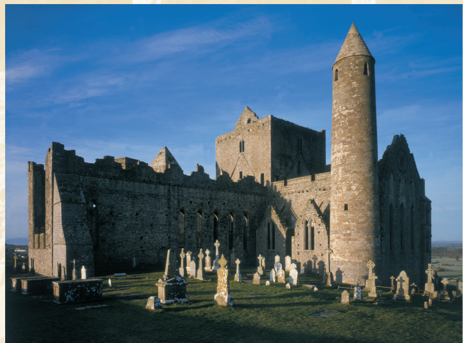
In alto: la torre rotonda e la cattedrale viste da nord est Sfondo: finestre del coro della cattedrale