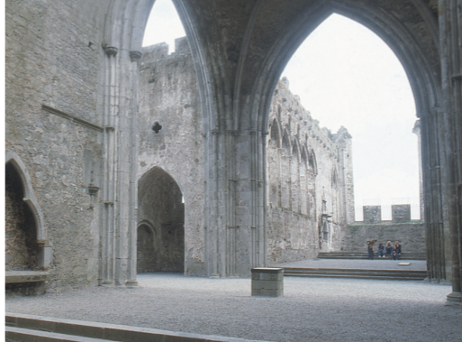
Nave y coro de la Catedral

El altar mayor estaba ubicado en el extremo oriental del coro. Únicamente sobrevive en la