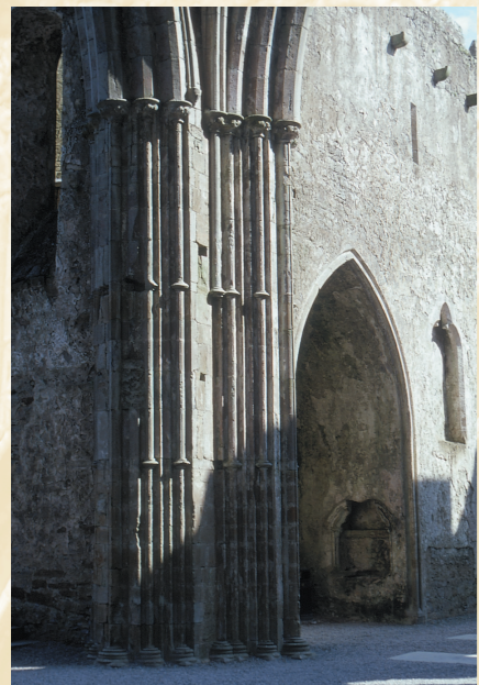
Pilar del crucero y capilla del transepto, Catedral