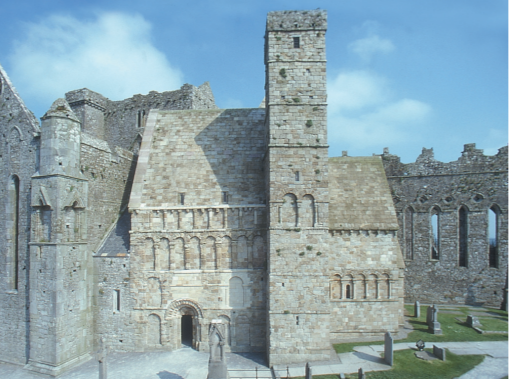
Capilla de Cormac

Entre la Sala del Coro de Vicarios y la Catedral se encuentra una réplica de la Cruz de San Patricio del siglo XII . La original se exhibe en la actualidad en los sótanos de la Coral de Vicarios. La cruz no es una típica cruz celta irlandesa, al no contar con un anillo alrededor de la parte superior de la cruz e incorporar soportes adicionales en cada uno de los lados del eje, a pesar de que únicamente sobrevive uno de ellos. Como es el caso de la mayoría de cruces celtas del siglo XII , aparece la figura de un Cristo crucificado con vestiduras largas en uno de los lados, mientras que en el otro se muestra la figura de un obispo o abad. La a menudo repetida teoría de que el pedestal era la piedra a la que subían los reyes de Cashel para ser coronados resulta muy improbable,