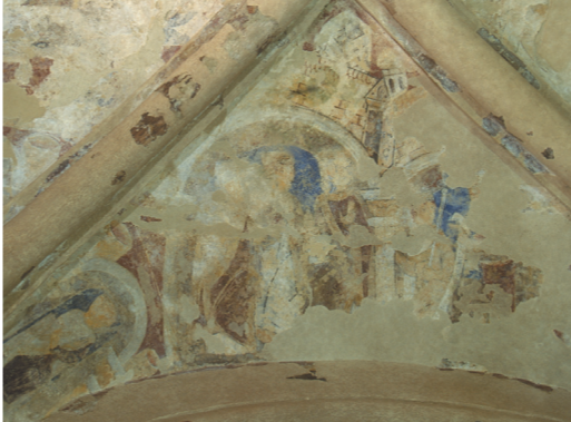
Pintura del siglo XII en el techo del presbiterio de la Capilla de Cormac

El presbiterio es prácticamente cuadrado sobre plano, con una entrada al altar que se proyecta externamente en su extremo oriental. Una característica singular de la capilla es que el presbiterio se encuentra en una posición descentrada respecto a la nave. El arco del presbiterio, de cuatro órdenes, presenta pilares y capiteles finamente tallados. El segundo orden desde el exterior incorpora una excepcional serie de cabezas en piedra en los pilares y en el arco. Las molduras enrolladas del arco conservan una