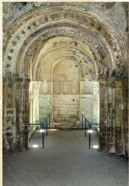
Interior de la Capilla de Cormac