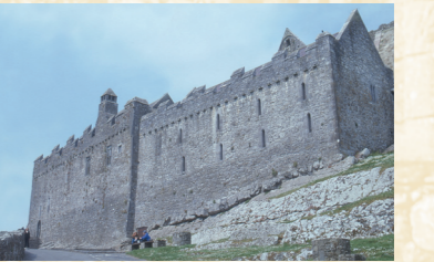
Derecha: Sala y residencia de la Coral de Vicarios vistas desde el sur De fondo: Ventanas del coro de la Catedral

El nivel superior incluía las salas de estar principales de la Coral de Vicarios, con una gran chimenea en el muro sur. Esta estancia se ha restaurado con una galería de madera en su extremo occidental. Los sótanos abovedados debajo de la sala dan cabida a una colección de esculturas en piedra procedentes de la Roca en su gran mayoría. La Cruz de San Patricio original se aloja aquí para protegerla de las condiciones climatológicas.