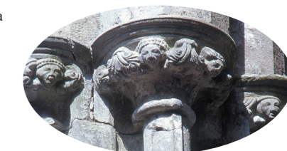
Derecha: Cabezas talladas en los capiteles del siglo XIII

Cashel habría tenido una iglesia o catedral relativamente grande poco después de 1101 y con seguridad en 1111. Probablemente esta iglesia o catedral se encontraría en el extremo oriental del coro de la catedral del siglo XIII. En el año 1119, una rama de los Eóganacht, los Mac Cárthaigh, con sede en Desmond