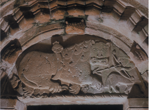
Tímpano sobre la entrada norte de la Capilla de Cormac

La puerta sur no resulta tan impresionante como la entrada principal original del lado norte del edificio, más grande y ornamentada. El tímpano tallado sobre esta puerta norte muestra la caza de un gran león por un pequeño centauro (mitad hombre, mitad caballo), dotado de arco y flecha y casco de estilo normando. En la actualidad rodeada por los muros de la catedral, esta entrada estaba