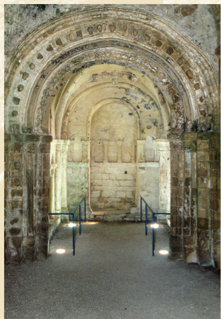
Wnętrze kaplicy Cormaca