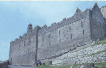
Po prawej: Sala i dormitorium Kantorów (Vicars Coral) od południa W tle: Okna chóru katedry

Na górnej kondygnacji znajdowało się główne pomieszczenie mieszkalne Kantorów z dużym kominkiem na południowej ścianie. To pomieszczenie zostało odnowione z wykorzystaniem drewnianej galerii w zachodniej części. W zwieńczonym sklepieniem pomieszczeniu pod salą znajduje się zbiór kamiennych rzeźb, w większości pochodzących ze Skały Cashel. Tu także jest przechowywany oryginalny Krzyż św. Patryka, chroniony w ten sposób przed zniszczeniem powodowanym przez czynniki atmosferyczne.