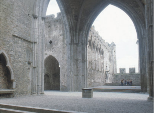
Nawa i chór katedry

Wysoki ołtarz został ustawiony we wschodniej części chóru. Do dzisiaj przetrwała jedynie niższa część wschodniego szczytu z niższą partią trzyczęściowego wschodniego okna. Szereg wysokich lancetowych okien w ścianie północnej i południowej odpowiada okresowi budowy tj. latom 30. XIII wieku. Pomiędzy szczytami tych okien znajdują się małe okienka z