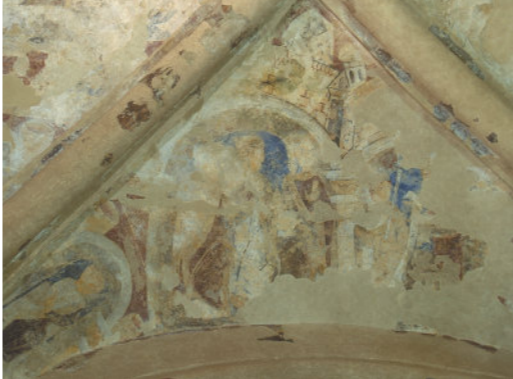
XII-wieczne malowidła na suficie prebiterium w kaplicy Cormaca

Prezbiterium w rzucie jest prawie kwadratowe z wystającą na zewnątrz wnęką ołtarza we wschodniej części. Zagadkową cechą charakterystyczną kaplicy jest to, że prezbiterium nie znajduje się w pozycji centralnej w stosunku do nawy. Łuk prezbiterium, składający się z czterech rzędów zawiera misternie wyrzeźbione kolumny i kapitele. Rząd drugi z zewnątrz charakteryzuje niezwykła seria kamiennych głowic na kolumnach i na łuku. Okrągłe profile łuku zachowały znaczną ilość oryginalnych średniowiecznych malowideł ozdobnych. Dwa zebra sklepienia prezbiterium 'wyrastają' z kątów i krzyżują się na środku, dzieląc powierzchnię sklepienia na cztery trójkątne obszary, na których znajdują się pozostałości malowideł a na