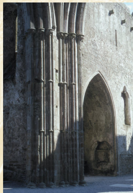
Filar krzyżowy i kaplica transeptu, katedra