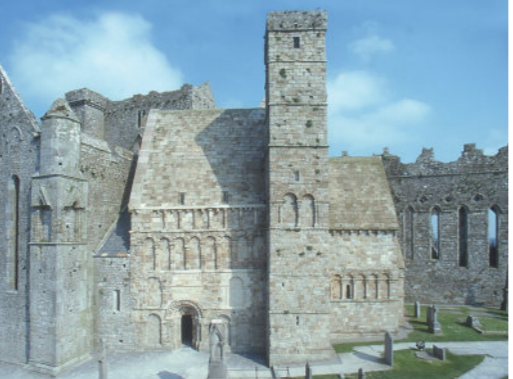
Kaplica Cormaca (Cormac's Chapel)

Kaplica Cormaca jest jednym z najstarszych i najwspanialszych kościołów w Irlandii, wybudowanych w stylu romańskim. Budynek składa się z nawy i prezbiterium oraz dwóch wystających wież - jednej na