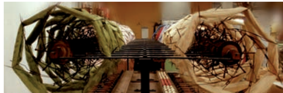
Museo de la seda de Moncada