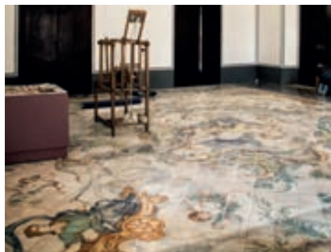
Museo del Colegio del Arte Mayor de la Seda