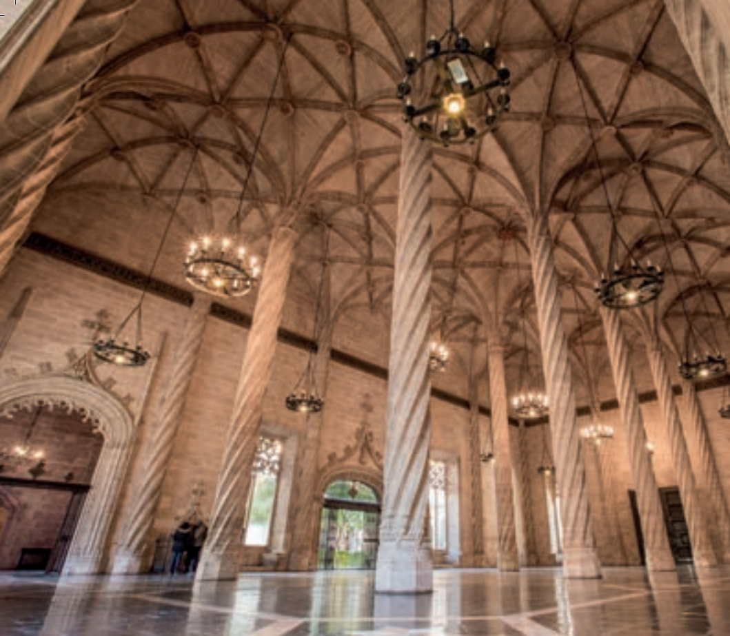
Lonja de la Seda