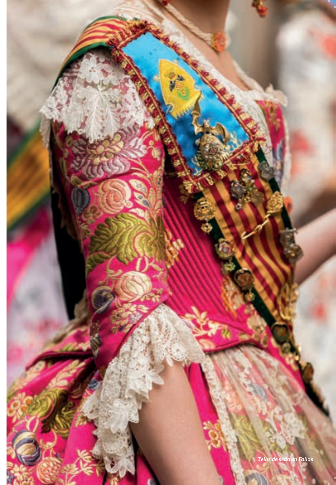
Telas de seda en Fallas

“Hoy de nuevo la Ruta de la Seda puede ser el hilo conductor entre Oriente y Occidente para intercambiar ideas, productos y negocios en una nueva era de concordia.”