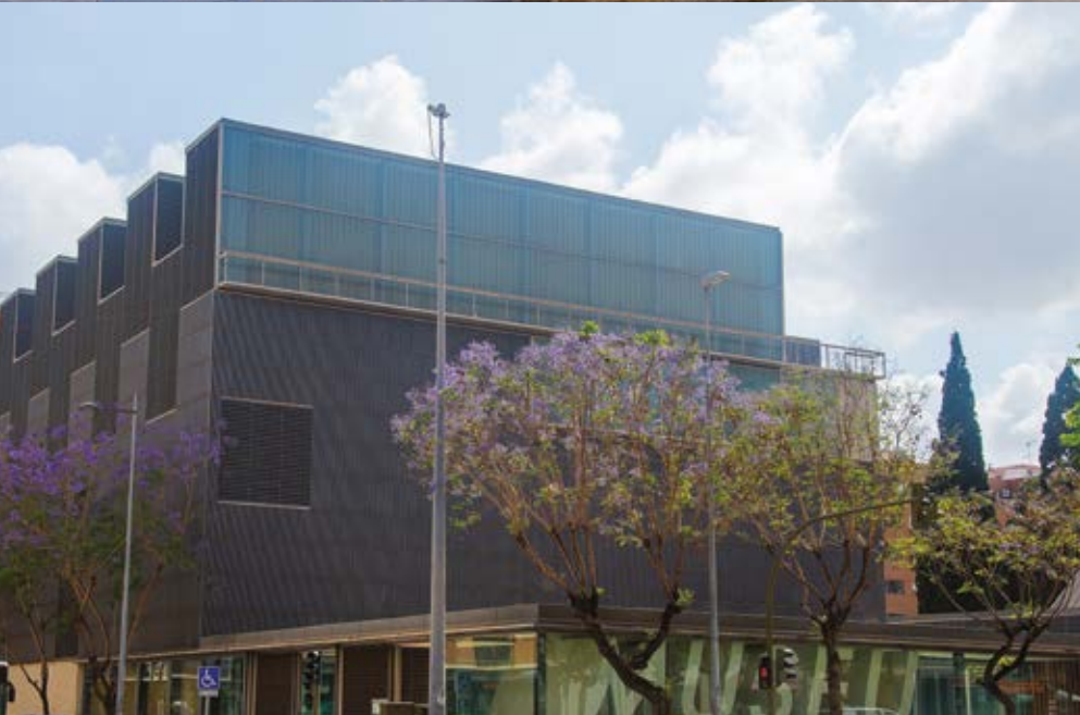
Museu de Belles Arts de Castelló de la Plana