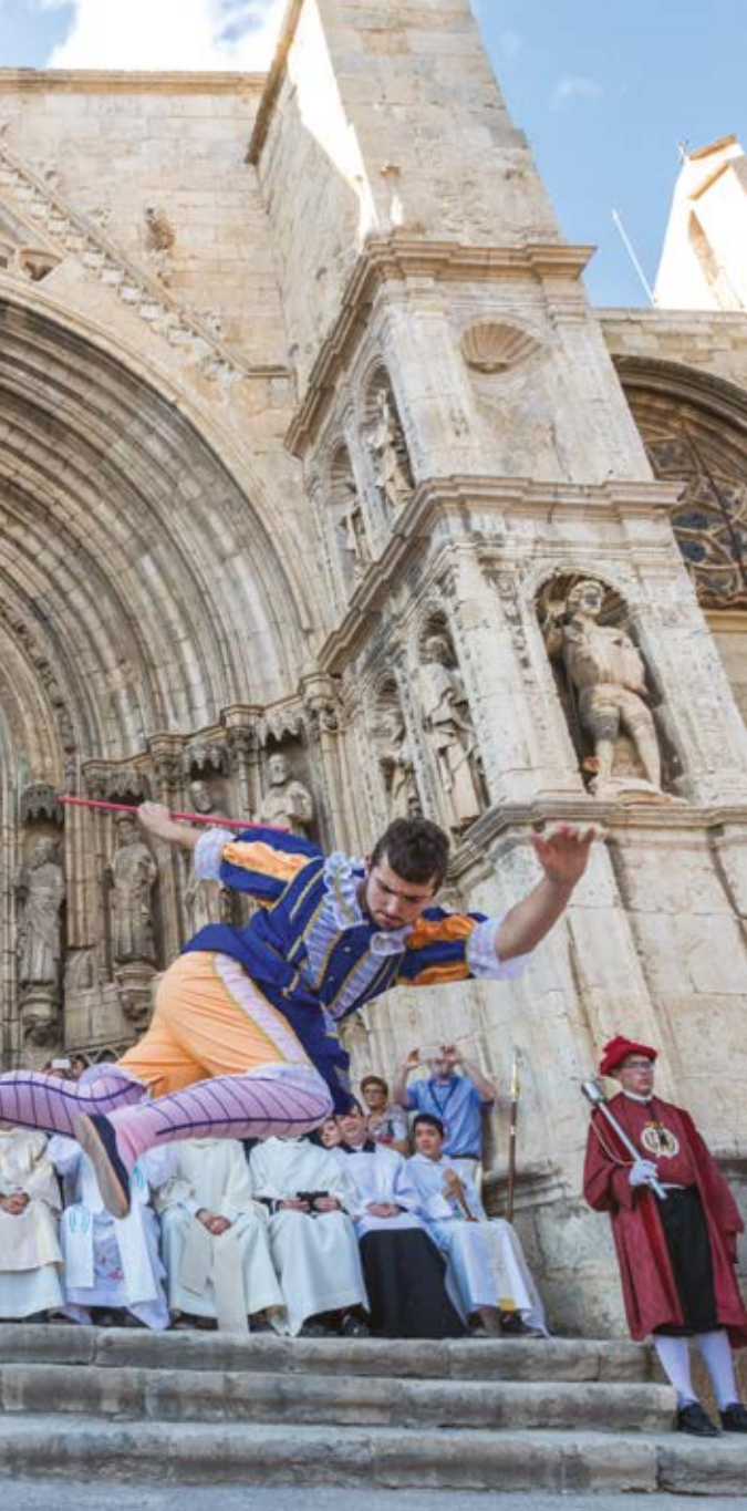
Festa del Sexenni, Morella (Castelló)