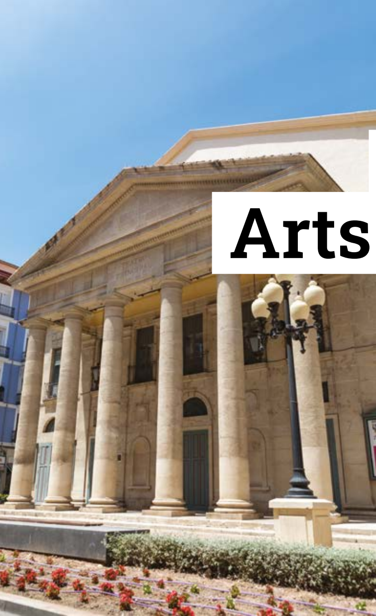
Teatre Principal d'Alacant