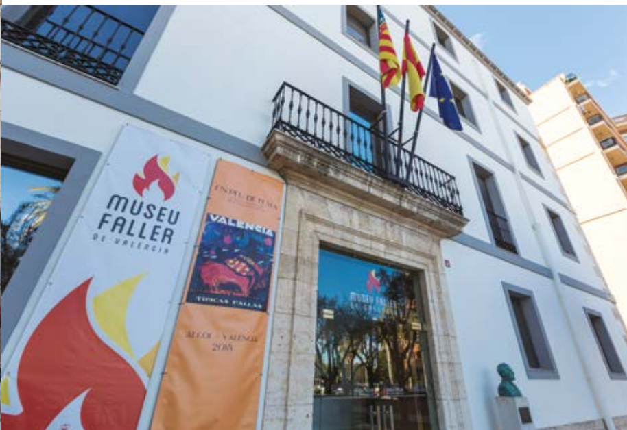
Museu Faller de València