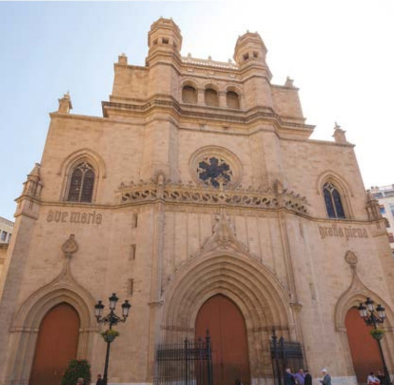
Catedral de Santa Maria, Castelló de la Plana