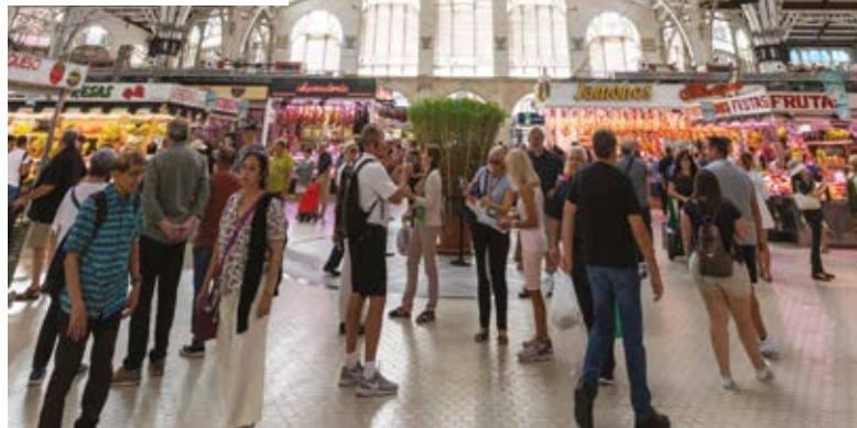
Mercat Central, València

Aquest espai, amb una sorprenent arquitectura modernista, es va començar a construir en 1914 (tot i que va ser inaugurat en 1928). Es troba entre els mercats de proveïments més estètics del món. Però no tot és l'estructura de metall ni els cridaners finestrals, sinó que a l'interior alberga una bona mostra de productes frescos i interessants llocs gurmet on prendre unes tapes.