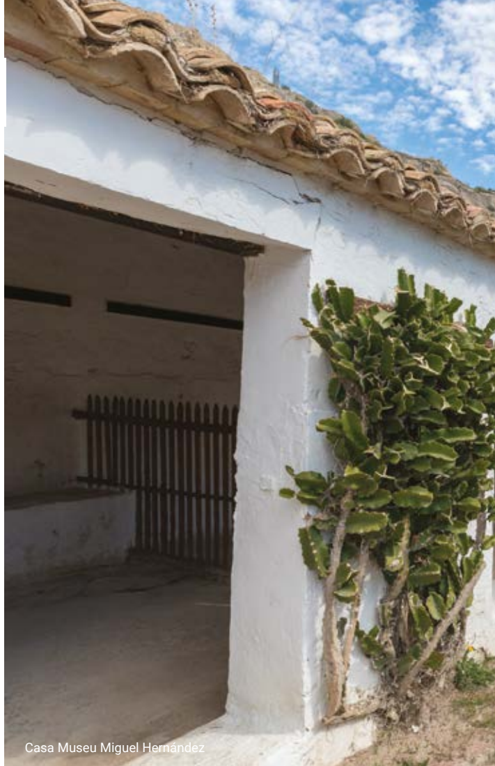
Casa Museu Miguel Hernández

L'escriptor alacantí Gabriel Miró té la seua casa-museu en una preciosa construcció modernista de la població de Polop. En aquest habitatge, situat al costat de la plaça dels Xorros i adquirit per l'Ajuntament per a aquesta finalitat, es ret homenatge a aquest gran autor que va passar les seues vacances d'estiu en la localitat des de 1921 fins a 1928. De fet, es declarava un enamorat d'aquest lloc i sempre el recomanava entre les seues il·lustrades amistats. Imatges, cites, vestuari... t'introduiran en el seu món d'una manera pausada.