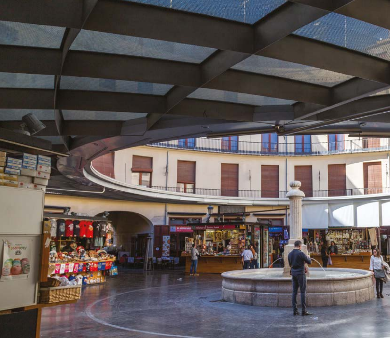
Mercat d'antiquitats de Xaló, Alacant