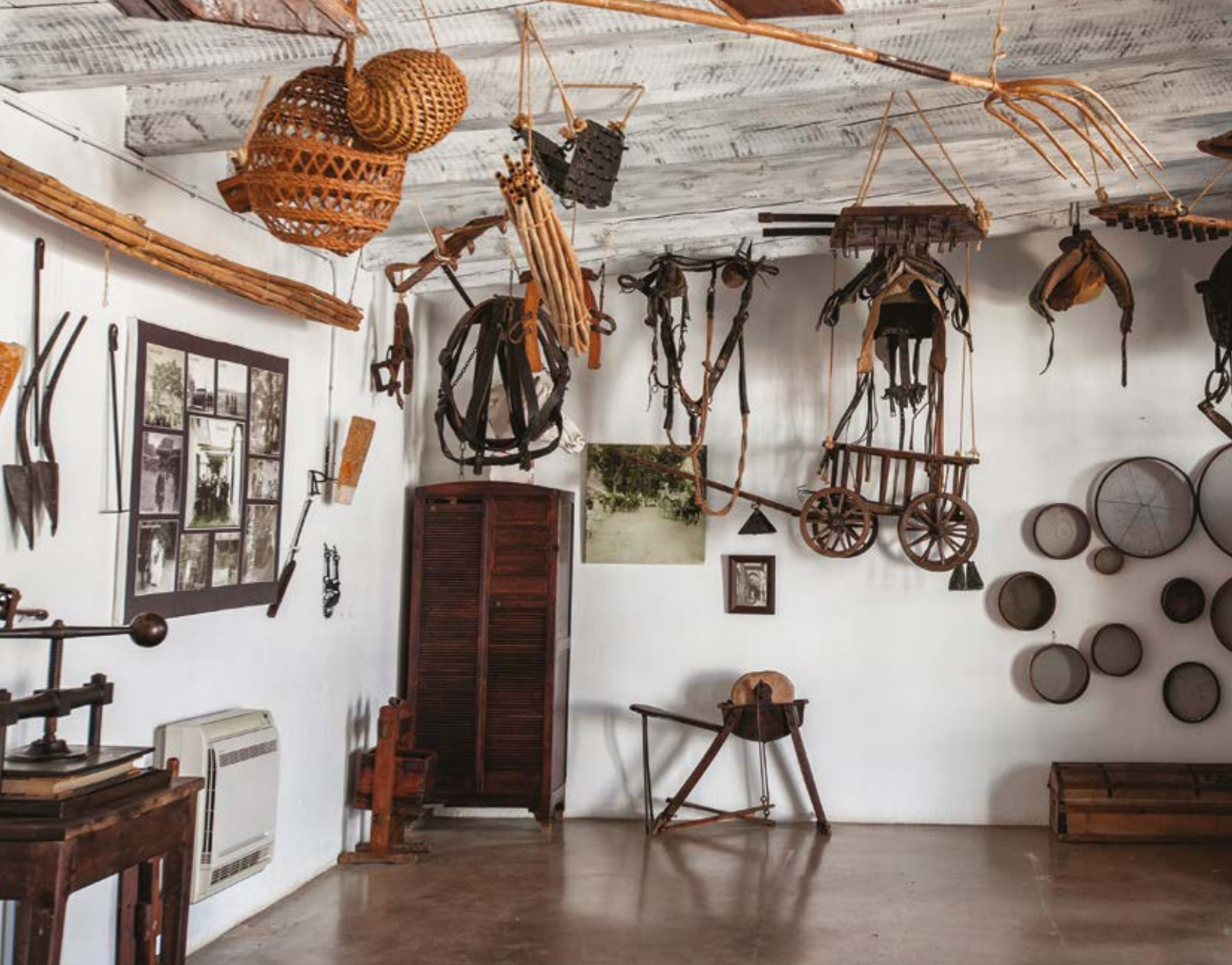
Museu de l'Orxata