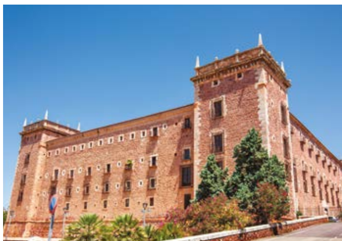
Monestir de Santa Maria del Puig

Aquesta fortalesa, d'una bellesa extrema, és de les que costa creure que no estàs somiant mentre observes que les muralles semblen rondar pel vessant de la muntanya fins al cim. A penes s'intueix, però es divideix en dues parts: el castell Menor i el castell Major. El primer, elevat sobre restes iberes i romanes, és el més antic, i regala una bella vista de la vall de Bixquert. El segon, d'època medieval, va arribar a ser la fortalesa més important de defensa entre Castella i el Regne de València després de la conquesta del rei Jaume I.