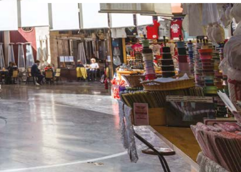
Plaça Redona, València