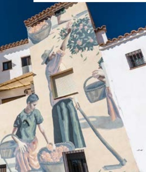
Art urbà a Fanzara