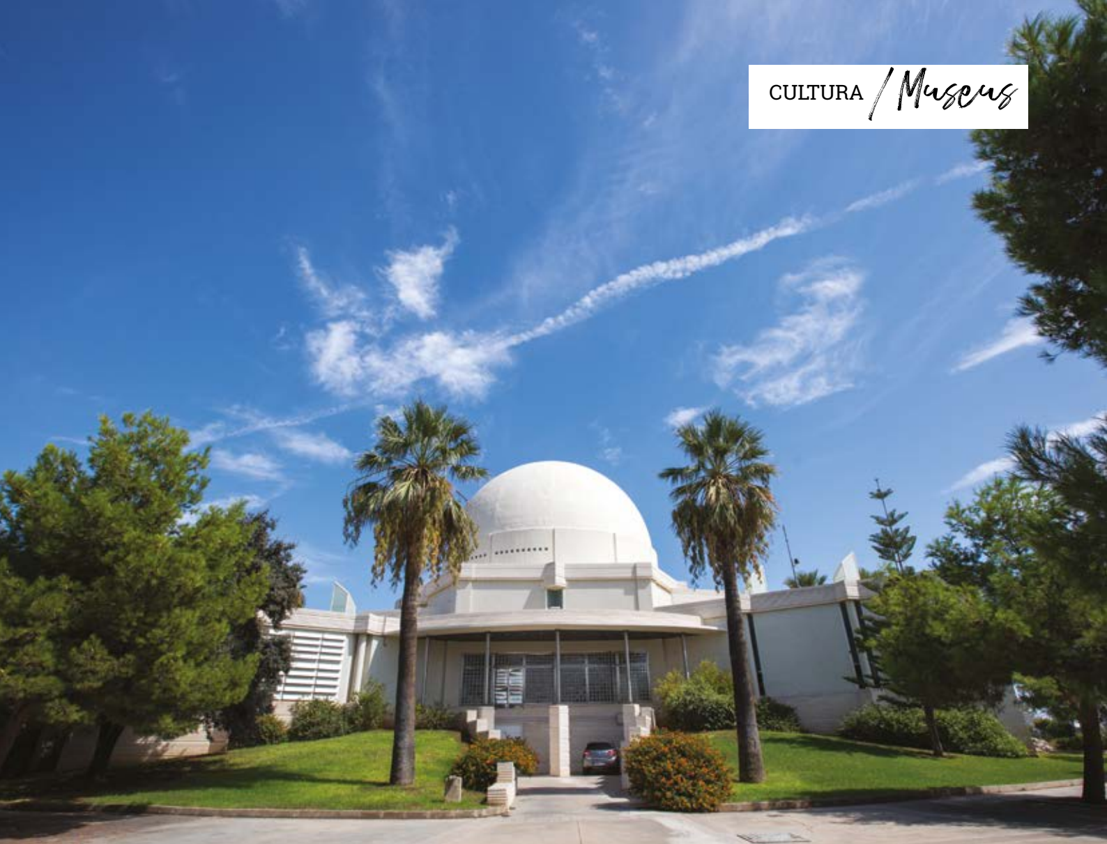
Planetari del Grau, Castelló de la Plana