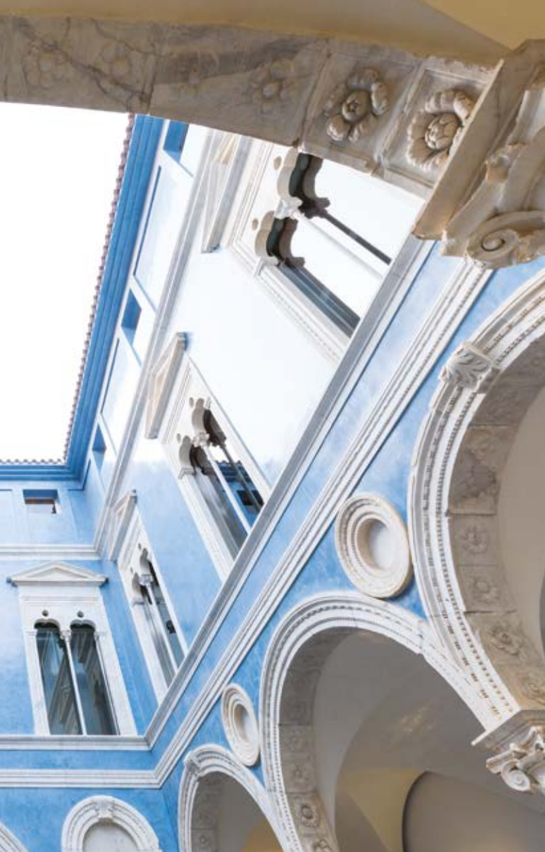
Museu Belles Arts Sant Pius V