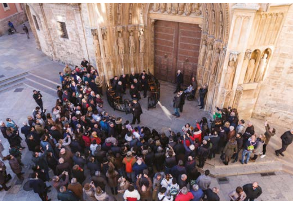
Tribunal de les Aigües

Els organismes s'adapten a les necessitats dels pobles i, en el cas de la Comunitat Valenciana, la creació del Tribunal de les Aigües de la Vega de València responia a la seua activitat agrària. Aquest tribunal, integrat des de fa segles per representants de les distintes comunitats de regants per a dirimir els seus conflictes, va ser reconegut en 2009 com a patrimoni cultural immaterial de la humanitat juntament amb el Consejo de Hombres Buenos de la Huerta de Murcia.