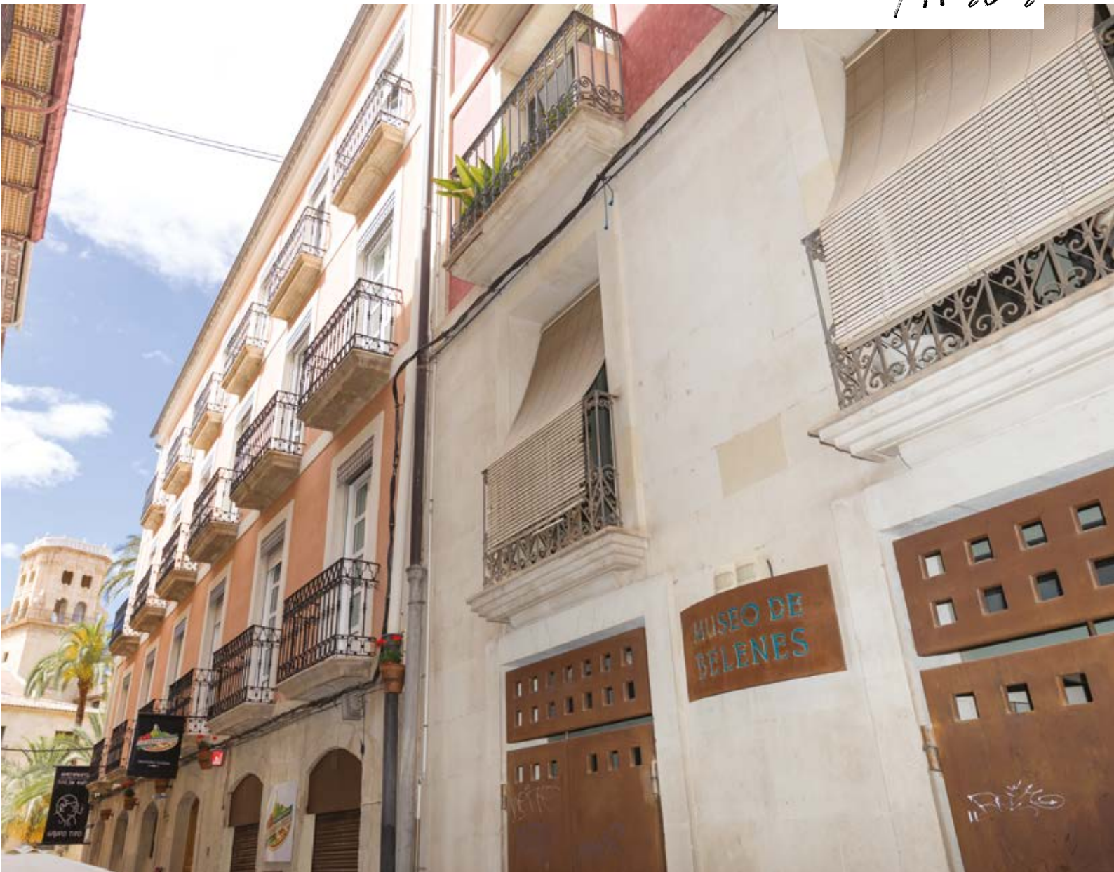
Museu dels Pessebres, Alacant