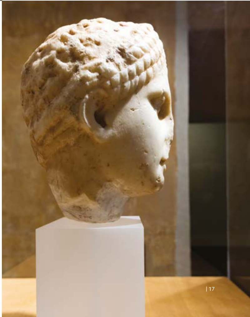
Museu Històric de Sagunt

La Casa del Mestre Peña s'ha convertit en un espai on es pot observar un ampli conjunt de peces arqueològiques trobades tant al castell de Sagunt com al nucli urbà i als voltants. A l'interior d'aquest habitatge gòtic del segle XIV s'exhibeix una col·lecció d'epigrafia llatina, mosaics i inscripcions amb caràcters ibèrics i hebraics. Algunes de les peces més sorprenents són una escultura d'un bou ibèric (segle IV a. de C.), gots ibèrics, ceràmiques de l'època del Bronze valencià i un cap de la deessa Diana.