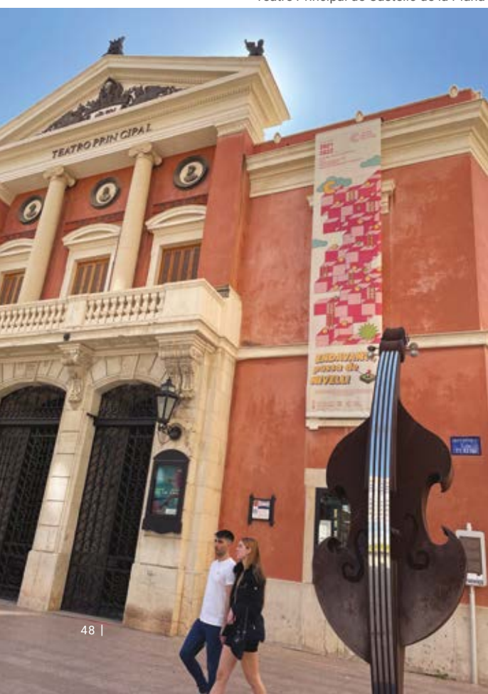
Teatre Principal de Castelló de la Plana

Aquest edifici avantguardista, situat al peu del castell de Peníscola, a més d'albergar congressos, acull una àmplia programació cultural durant tot l'any. Pel seu auditori, que té capacitat per a 700 persones, passen obres de teatre per a xiquets i per a adults, concerts de tot tipus de música i projeccions de pel·lícules.