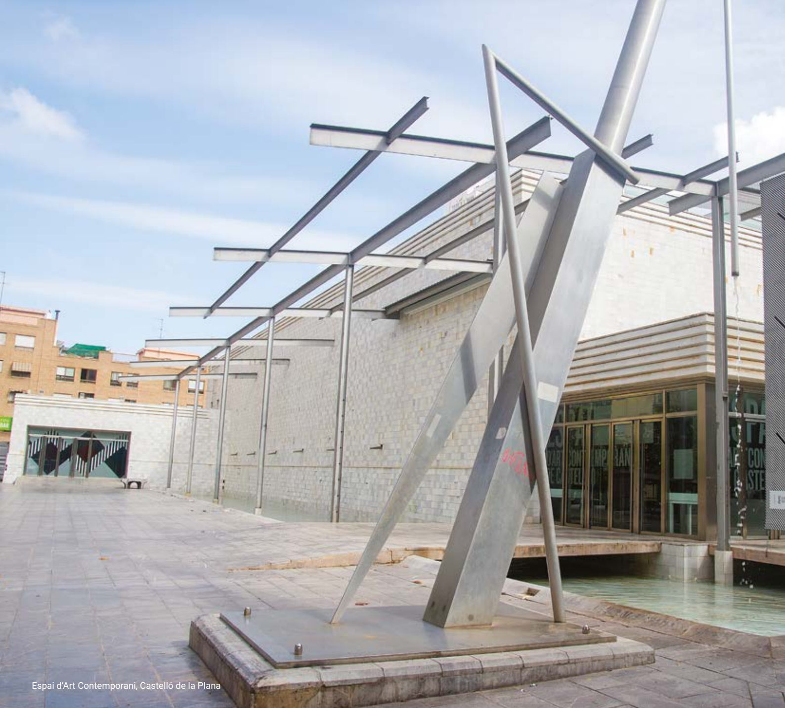
Espai d'Art Contemporani, Castelló de la Plana