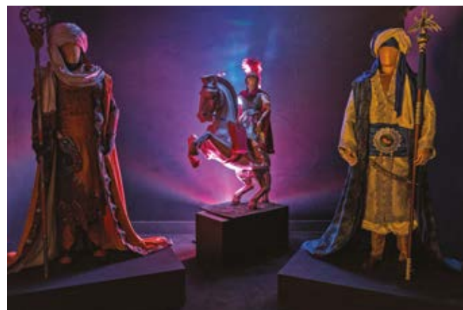
Museu Alcoià de la Festa, Alcoi (Alacant)

Aquest espai gestionat per l'Associació de Sant Jordi, a Alcoi, manté viva la festa de Moros i Cristians durant tot l'any i la dona a conèixer fent servir recursos tecnològics i didàctics. Des del museu alacantí no només tracten de difondre la celebració en si mateixa sinó que et conviden a viure una experiència que integra la imatge i els sons.