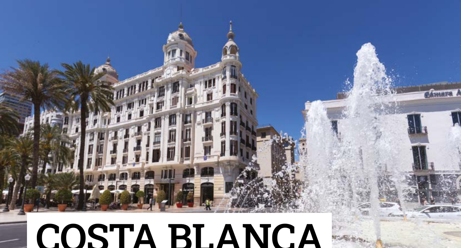
Casa Carbonell, centre d'Alicant