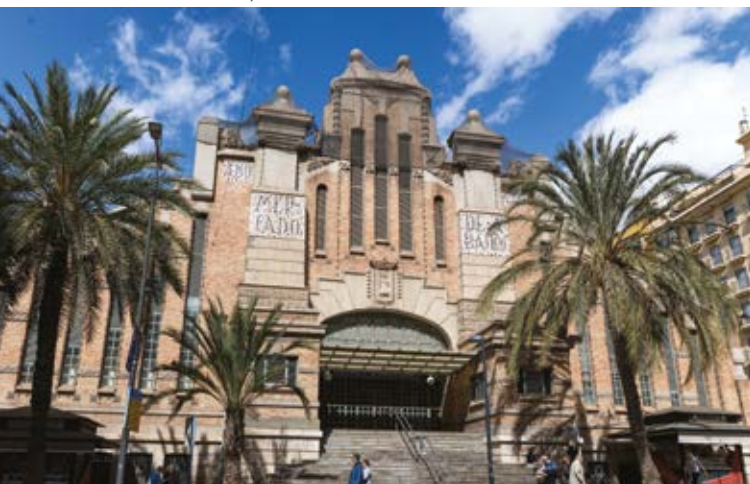
Mercat Central, Alacant

Té quasi 300 espais comercials i una història que es remunta a 1921. Durant aquest temps ha vist canviar la ciutat i ha patit l'impacte de la guerra, però ha mantingut la seua construcció estilitzada i eclèctica. Visita'l i recorre'l sense presses, admirant-ne el detalls modernistes.