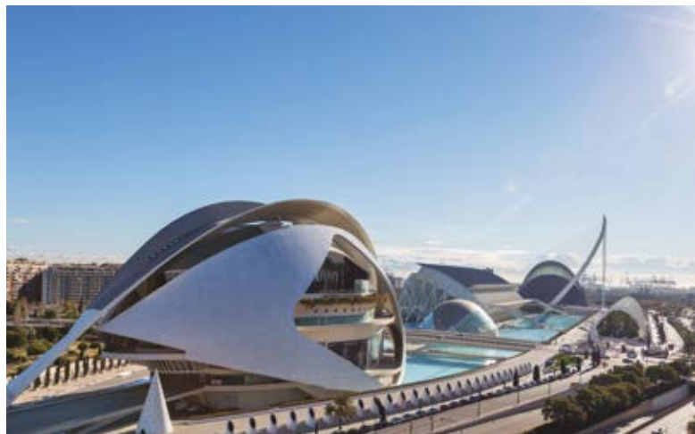
Ciutat de les Arts i les Ciències

A l'interior d'aquest palauet hi ha el Centre de Difusió Patrimonial que alberga els museus d'Etnologia i de l'Aigua. La recreació està tan assolida que traspassar-ne el llindar és traslladar-se a l'època musulmana a través del pati i les sales àrabs entre mosaics, guixereries i cassetonats. També hi ha espai per a l'Edat Moderna a les sales Borja i Cervelló i fins i tot s'hi ha reservat un lloc per a les famílies il·lustres del comtat.