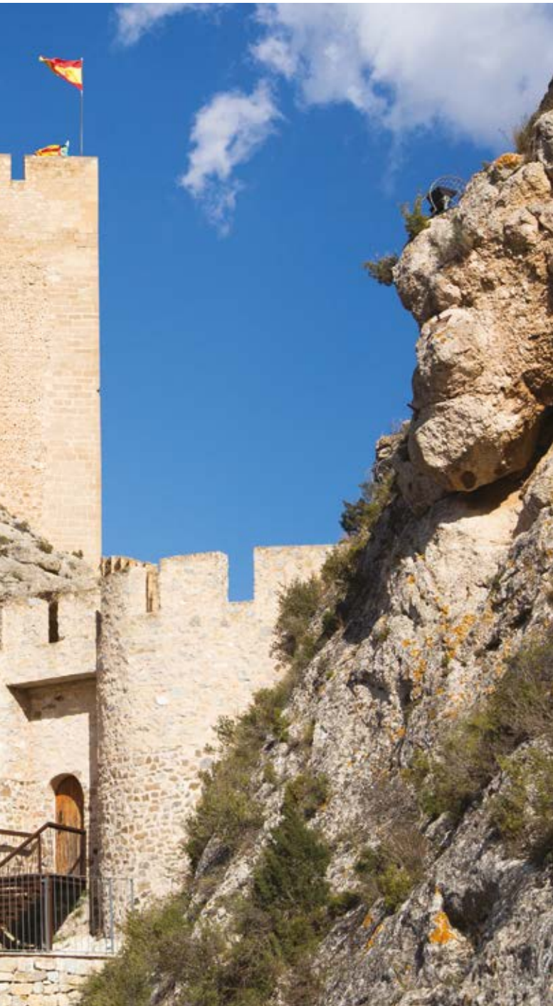
Castell de Sax, Alacant