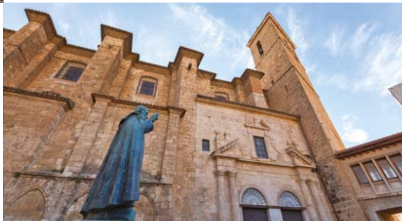
Catedral de Segorbe

La catedral de Segorbe, alçada sobre una antiga mesquita, va nèixer amb cor gòtic i adossada a la muralla en el segle XII, tot i que en el segle XVIII va ser adaptada als gustos academicistes. Aquesta evolució permet admirar en un mateix lloc un claustre baix gòtic on s'obren diverses capelles amb entrades barroques i un temple il·lustrat. Una lliçó d'art en tota regla.