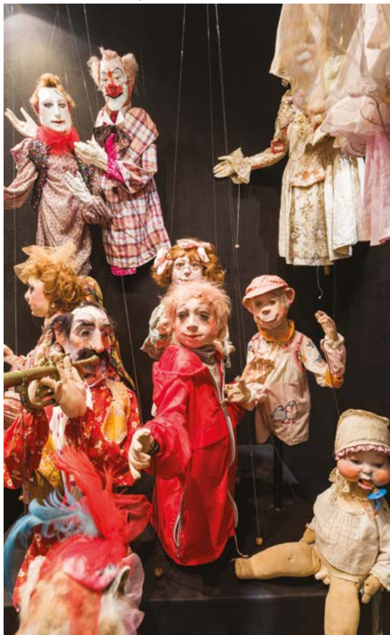
Museu Internacional de Titelles, Albaida