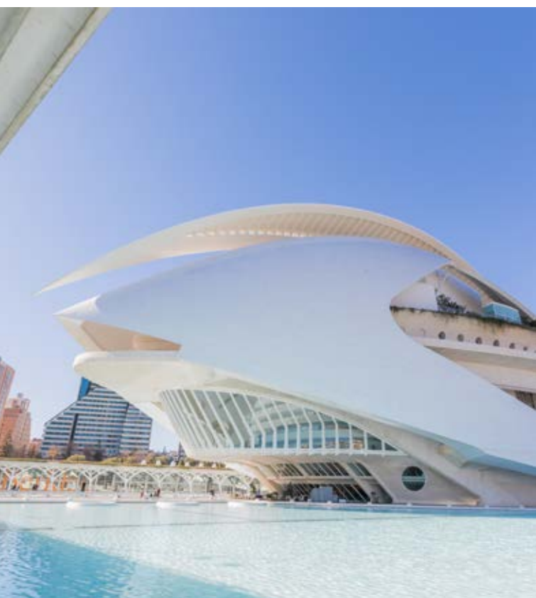
Palau de les Arts Reina Sofia