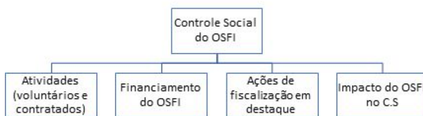
Figura 3 – Categoria e subcategorias do bloco 3.

A figura a seguir demonstra a segunda categoria construída para análise de dados textuais dos entrevistados no bloco 3. Como categoria central está o Controle Social do OSFI, com suas subcategorias: atividades (voluntários e contratados), financiamento do OSFI, ações de fiscalização em destaque, ou seja, as mais citadas pelos entrevistados, e o impacto do OSFI no controle social.