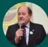
NEY RIBAS FORÇA TAREFA CIDADÃ