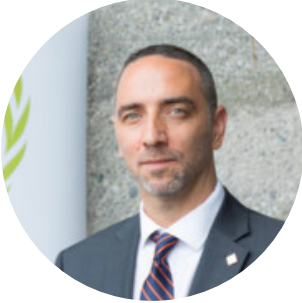
Mariano Brener Coordinador Regional para las Américas de AISS

Solamente el 45% de los países en el mundo disponen de una prestación por desempleo en el marco de programas de seguridad social y nada más el 4% los tienen en el marco de asistencias sociales o transferencias monetarias.