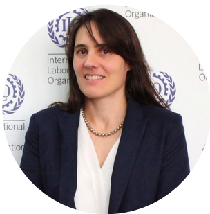
Celine Peyron Asesora en jefe del departamento de Protección Social de OIT - Ginebra

Ningún sistema de protección social estaba preparado para dar respuesta a una crisis económica, sanitaria y social como la provocada por la Covid 19 a nivel mundial. Lo que está en cuestión, por tanto, no es la existencia de estos sistemas sino su capacidad para hacer frente a crisis de magnitudes globales y la manera de prepararlos a través de proceso de expansión de cobertura y mejora; y cómo estos mecanismos pueden ser sensibles y considerar a los grupos de trabajadores más vulnerables como los informales e independientes.