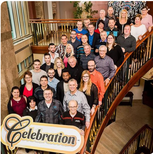
Les participants au gala Célébration 2018 en compagnie des animateurs Yves Corbeil et Marie-Mai

Du 1 er avril au 25 décembre 2017, Loto-Québec a versé plus de 14 000 lots ou parts de lot de 1 000 $ ou plus aux gagnants à la loterie, dont 65 lots de 1 M$ ou plus.