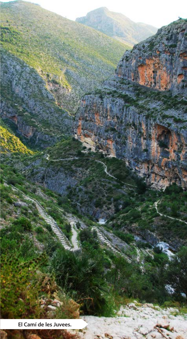
El Camí de les Juvees.

izquierda, un barranco que induce a confusión.