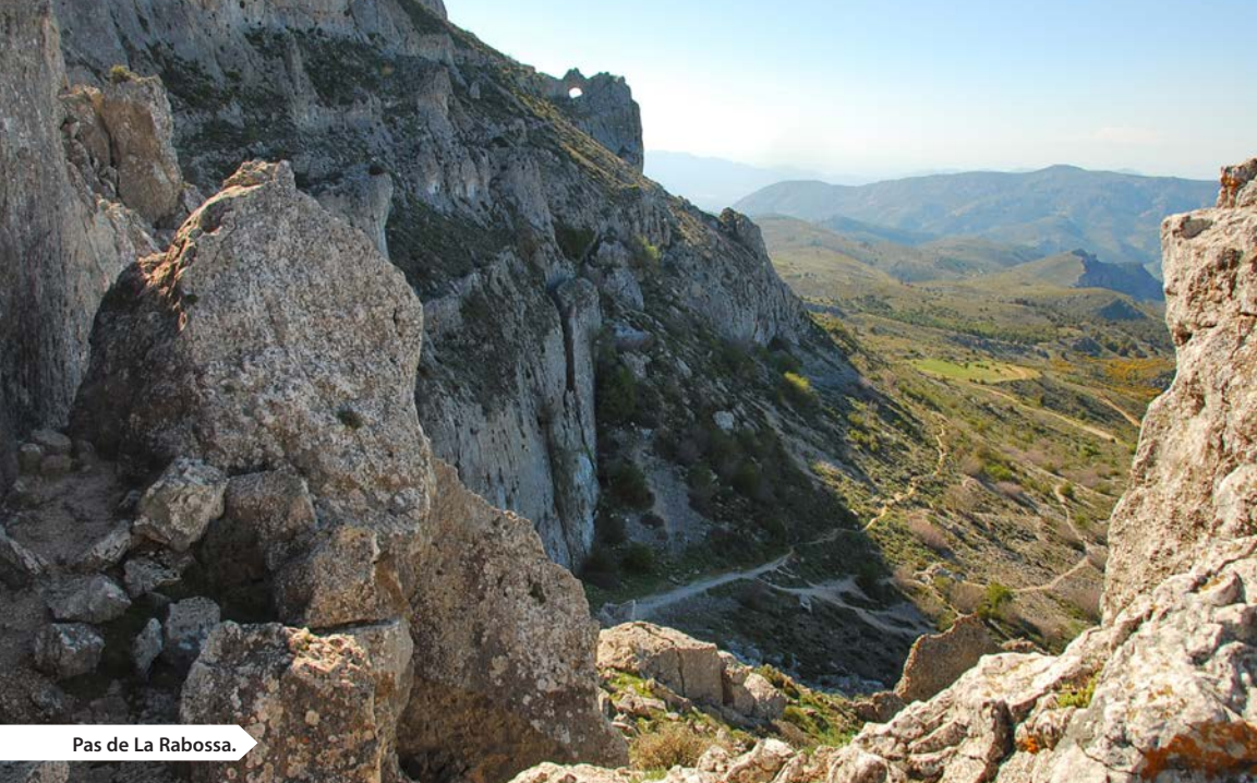
Pas de La Rabossa.

Es la expresión de la fuerza de la naturaleza. Franqueada la estrecha portilla aparece un impresionante escenario: els avencs de Partegat, la estremeecedora y fría belleza de las tablas calizas, quebradas en profundas grietas entrecruzadas, sombrías cicatrices abiertas por la fuerza interior de la tierra. Tres colosales fracturas de vertical absoluta, una de las cuales tiene cerca de cien metros de profundidad. Están abiertas en líneas quebradas