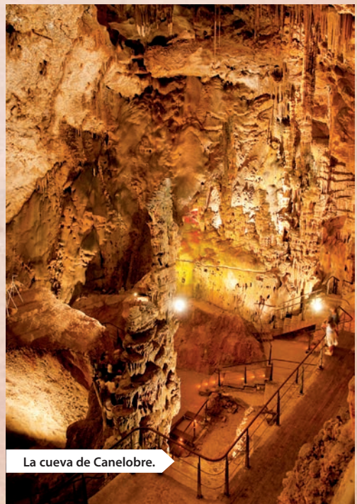
La cueva de Canelobre.

Punto de partida: Pla de la Gralla, panel del PR-CV 2, a 515 metros de altitud. Inicio del recorrido a pie, junto a la carretera de acceso a Canelobre y 700 metros antes de llegar a la misma. Hay espacio para varios coches. Junto al panel arranca una pista, solamente apta para todo terreno que recorre longitudinalmente el pie de la cortada fachada de poniente, sin apenas desnivel. A 300 metros dejamos un camino particular a la izquierda. El camino a