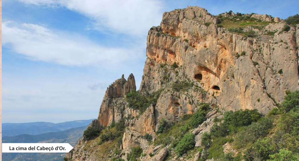
La cima del Cabeçó d'Or.

media ladera es un buen observatorio de la cortada vertiente que singulariza a la sierra. Queda a los pies el desigual espacio de lomas surcadas de barrancos y los montes, tierras ocre y blanquecinas de visible aridez. La carencia de agua no fue un obstáculo para la conquista de nuevas tierras de labor, transformando un paisaje que ya es, tan solo, el silencioso testimonio del pasado. A unos 1.170 metros, hay un atril informativo sobre la flora y a 1.490 metros, a la izquierda una casa restaurada, punto desde el que desciende suavemente la pista. Unos alzados contrafuertes rocosos separados de la línea maestra de la sierra, anuncia la entrada al Racó de Seva , un anfiteatro rocoso abierto bajo la cumbre, como escenario donde la vertiente más activa de la sierra muestra su más llamativa arquitectura.