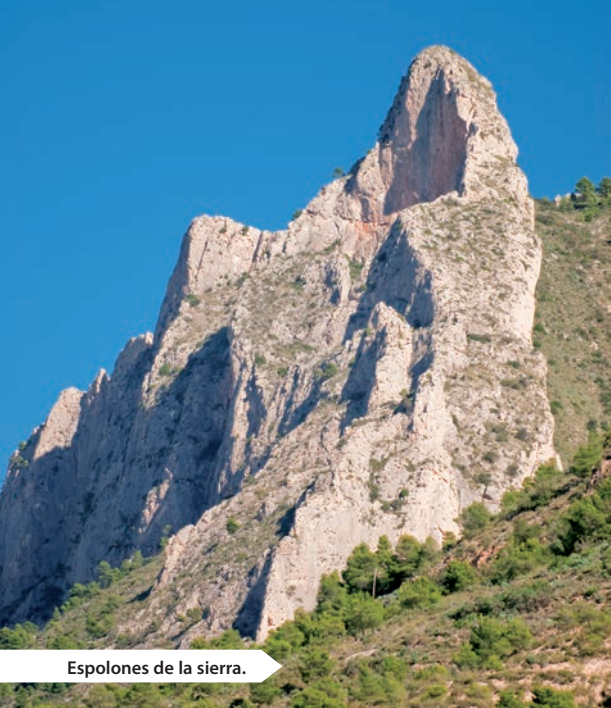
Espolones de la sierra.

La agricultura de secano tiene aquí el almendro como frutal por excelencia de la montaña alicantina. Es un árbol poco exigente con el medio, de luminosa floración en el corazón del invierno, blanca o suavemente sonrosada. La montaña mediterránea es el refugio natural de este árbol oriundo de lejanas tierras. La almendra, la miel y la tradición artesana heredada de los árabes, componentes básicos del turrón y la laboriosidad local, han creado un dulce imperio que lleva como divisa por el mundo el nombre de Xixona.