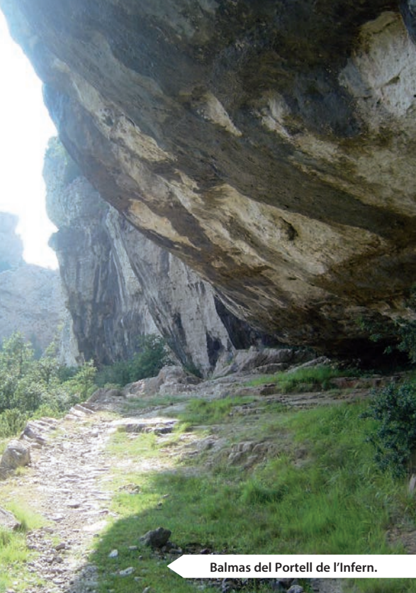
Balms del Portell de l'Infern.

cisterciense en las cercanías del castillo árabe de Beni-Hassan. El resto de construcciones (el claustro, las sacristías, la sala capitular y el Palacio del Abad) datan del siglo XIV. A mediados del siglo XVIII el nuevo abad Ferrer amplió el Molí (hoy llamado del Abad) y realizó obras en el complejo del monasterio para acoger a los visitantes. El ilustre botánico valenciano Antonio José Cavanilles visitó el Monasterio en 1794, citando entre otras cosas curiosas el Pont dels Magraners, hoy inundado por el embalse. Tras disoluciones y restituciones de órdenes religiosas llega en 1835 la ley de desamortización de Mendizábal, que acabó con el carácter religioso del complejo. El general Cabrera lo usó como hospital y miserable cárcel. En 1931 y más tarde en 1967 un grupo de interesados encabezados por la Diputación Provincial de Castellón recuperan el complejo y lo ceden a la Orden cartuja de San Bruno. Hoy esta cartuja alberga una comunidad de religiosas. Estas, siguen estrictas normas de clausura y se mantienen totalmente aisladas del exterior. Actualmente se puede visitar la iglesia los jueves de 13 horas a 15 horas.