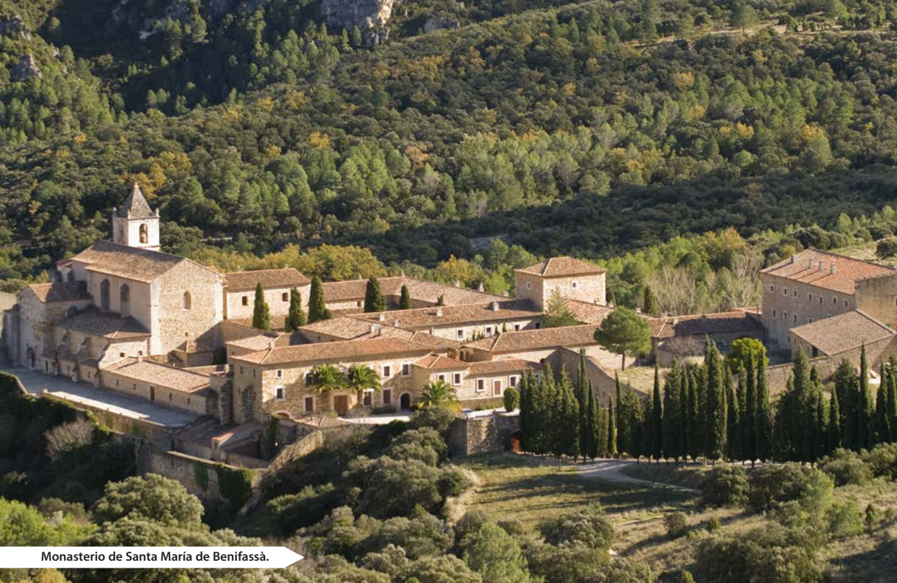
Monasterio de Santa María de Benifassà.