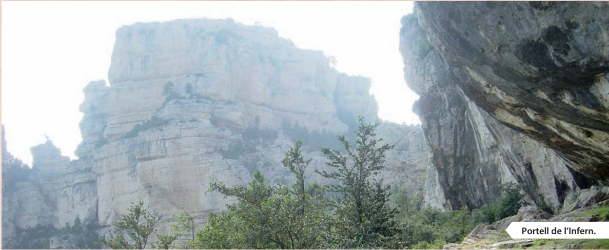
Portell de l'Infern.