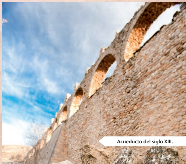
Acueducto del siglo XIII.

que da acceso a la parte superior. Seguimos en ascenso unos metros hasta un poste indicativo, donde dejamos a la izquierda el camino que lleva al ascenso final hasta lo más alto de la muela. Desde el Penyagolosa hasta la Serra de Sant Marc en Torre Miró la vista es extraordinaria. Seguimos por la derecha llaneando y recorriendo toda la umbría bajo un poblado bosque de pinos. Un vez más la vista es excepcional, ahora nos deleitamos viendo la Fàbrica Giner y la impresionante Mola d'en Camaràs. La Fàbrica Giner se distingue claramente cerca del campo de fútbol por su portentosa chimenea y sus grandes edificios herederos de un pasado glorioso. Ya en 1791 el ilustre Antonio José Cavanilles señaló la importancia textil de Morella. En esta fábrica se realizaba todo el proceso textil, llegaban los carros con la lana recién esquilada y salían telas de todo tipo preparadas para darle el uso requerido. Llegó a ser una de las más importantes de España con exportaciones a toda Europa. Como detalle, vale decir que en 1884 el propietario instaló teléfono comunicando la fábrica con su casa de Morella, siendo el segundo teléfono de la provincia en esta clase de servicio particular. Llegaron a trabajar más de 200 trabajadores que vivían y comían dentro del complejo fabril.