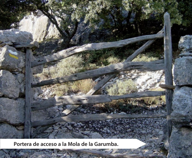
Portera de acceso a la Mola de la Garumba.

y recorriendo sierras y muelas se alcanza la maravillosa población de Forcall, rodeada por cuatro espectaculares muelas e inteligentemente asentada sobre tres corrientes fluviales, que dan nombre a la población por su comparación a la horca que en este caso forman los ríos Cantavieja, Caldés y Bergantes. Precisamente este último lo cruza en dos ocasiones y acompaña en la distancia gran parte del recorrido. La mayor parte del mismo discurre por la impresionante Mola de la Garumba que aunque no podamos ver por estar encima de ella, podemos imaginar al apreciar la no menos descomunal Mola d'en Camaràs que encajona al Bergantes por el norte.