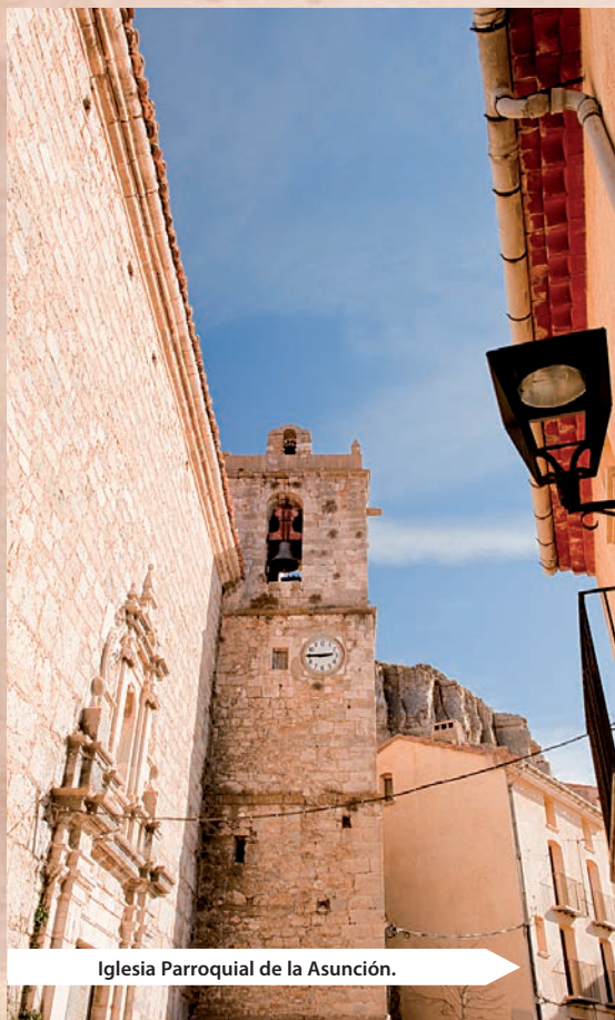
Iglesia Parroquial de la Asunción.

Pinturas rupestres: también enclavadas en el LIC de l'Alt Maestrat. El conjunto de pinturas rupestres del término municipal de Ares es, junto con los de la Valltorta (en las cercanas poblaciones de Tírig y Albocàsser) uno de los mejor conservados de todo