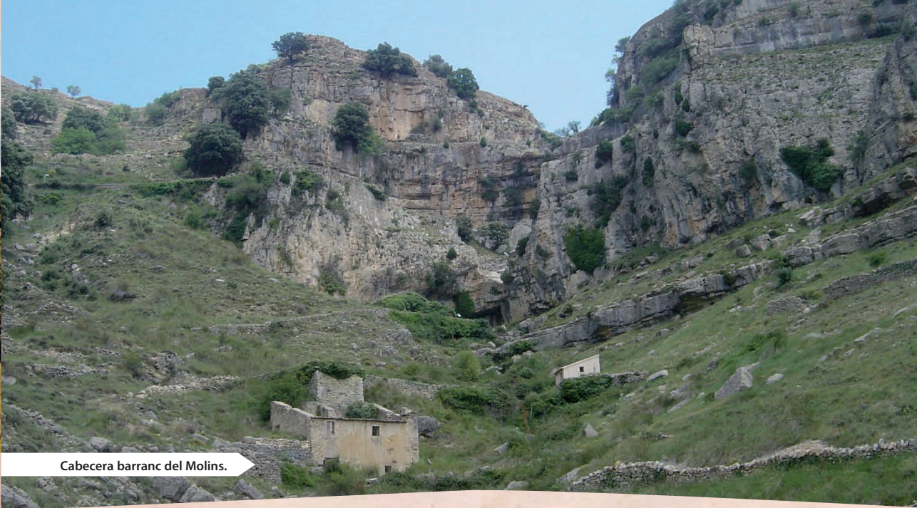
Cabecera barranc del Molins.

de harina hicieron que sus accesos en forma de caminos fueran desarrollados magníficamente en una orografía con fuertes desniveles. El recorrido circular se plantea en el mismo sentido que lo hacía el agua en su estudiado recorrido de molino a molino. De esta forma no solamente apreciaremos mejor el complejo sistema hidráulico, sino que disfrutaremos de un marco paisajístico de gran envergadura. Esta red que conducía el agua desde l'Ull de la Roca en el primer molino hasta su salida en el Molí del Sòl de la Costa aprovechaba el agua hasta cinco veces sin consumirla ni contaminarla. De los cinco molinos cuatro son excepcionales por uno u otro motivo, el primero por su gran caída de agua de 23 metros (la mitad excavados en la roca) que la convierten en la más alta de cuantos molinos hay en la provincia de Castellón, el segundo por su curiosa caída de agua de forma hexagonal (aspecto único a nivel provincial), el tercero por su potente rampa cubierta de escalones y el quinto por su imponente acueducto de 36 metros de longitud. Es en el quinto de los molinos donde llega el tráfico rodado procedente de la carretera CV-15 y, por tanto, donde existe la posibilidad de acortar el recorrido.