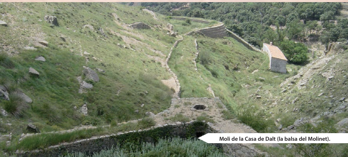
Molí de la Casa de Dalt (la balsa del Molinet).

1,4 kilómetros/30 minutos. Unos metros después, un poste indicativo nos señala el camino a l'Ull de la Roca que, aunque nos aparta momentáneamente de nuestro camino, bien merece una visita puesto que se trata del mayor salto de agua para un molino de agua de toda la provincia. Siguiendo el descenso llegamos al Molí de la Roca, donde balsas y acequias se concentran aguas arriba para transformar el líquido elemento en energía mecánica con la que mover las piedras que molían el grano. La imagen de los otros molinos cercanos invita a la contemplación en un entorno espectacular. Apenas 100 metros después llegamos al Molinet, donde destaca su caída de agua hexagonal. En unos metros cruzaremos a la orográfica izquierda del barranco para llegar al Molí de la Casa de Dalt, característico por su balsa bien conservada y por su potente caída de agua en rampa cubierta por una impresionante escalera de piedra.