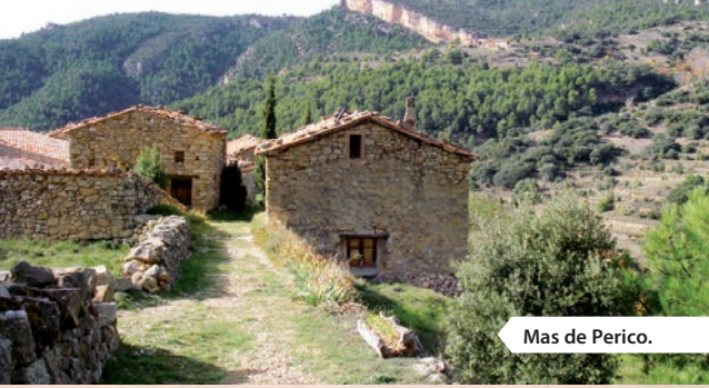
Mas de Perico.