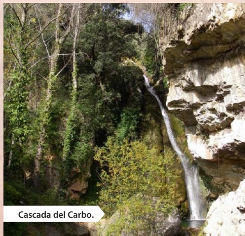
Cascada del Carbo.

Punto de partida. Es el ermitorio de Sant Joan de Penyagolosa a donde se accede primero desde Adzaneta del Maestrat por la carretera CV-170, y después de pasar Vistabella del Maestrazgo y ya de camino a la población de Puertomingalvo por pista asfaltada a la altura del kilómetro 38,2 de la citada carretera CV-170. Para acceder a Villahermosa del Río se puede tomar la carretera CV-190 en la población de Alcora