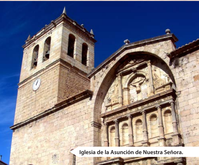
Iglesia de la Asunción de Nuestra Señora.

(capital de la comarca de L'Alcalatén), pasar por Lucena del Cid y tomar la carretera CV-175 que también alcanza la población turolense de Puertomingalvo.