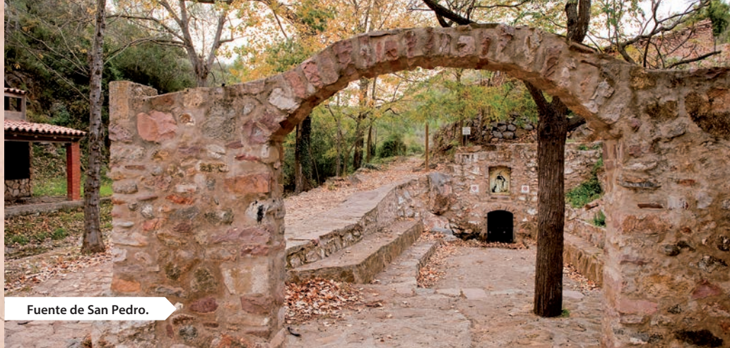
Fuente de San Pedro.

lleva a Algimia de Almonacid. Hay que seguir el de la derecha que lleva a la carretera CV-223.