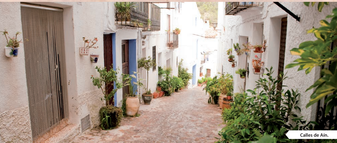
Calles de Aín.