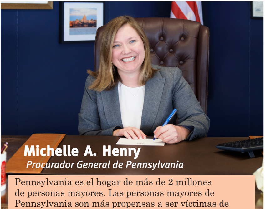
Michelle A. Henry Procurador General de Pennsylvania

Pennsylvania es el hogar de más de 2 millones de personas mayores. Las personas mayores de Pennsylvania son más propensas a ser víctimas de ciertos delitos, como fraude, robo de identidad, estafas y explotación financiera. Demasiados actores del mal y delincuentes ven a nuestros ciudadanos mayores como vulnerables y buscan explotarlos y aprovecharse de ellos. De hecho, las personas mayores de todo el país pierden $3 mil millones cada año por estafas y fraudes..