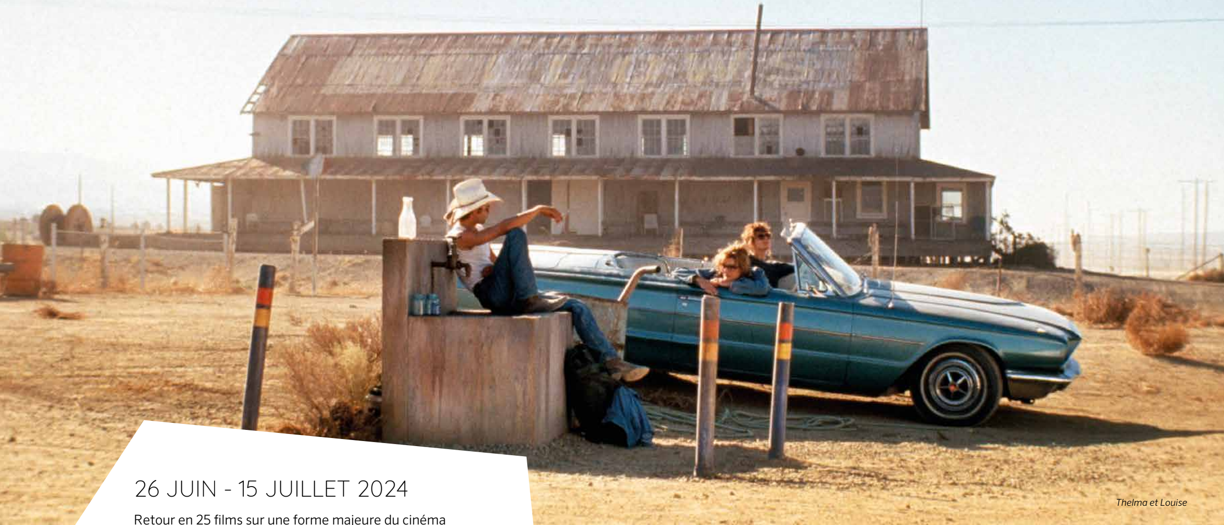
Thelma et Louise