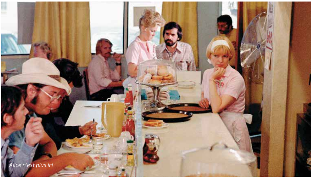
Alice n'est plus ici