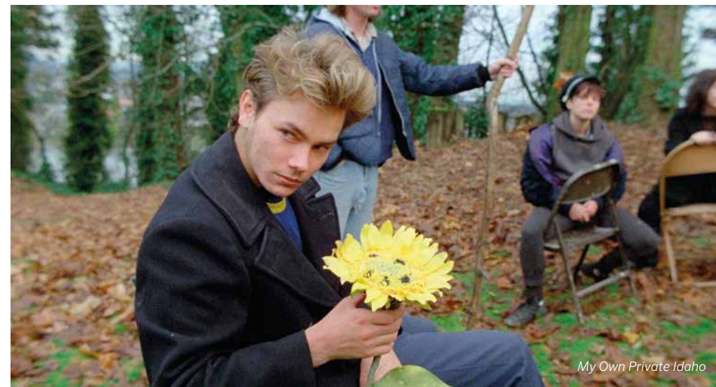
My Own Private Idaho