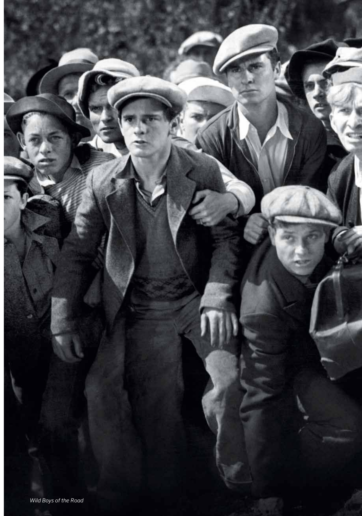
Wild Boys of the Road