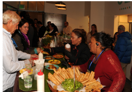
Chefs en la incubadora de alimentos Comal