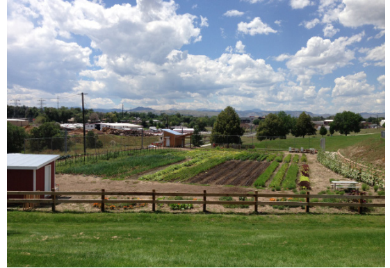
Delaney Granja Urbana

R3.F. Seguir con la plena aplicación del programa del plan maestro de residuos sólidos e iniciativas de políticas