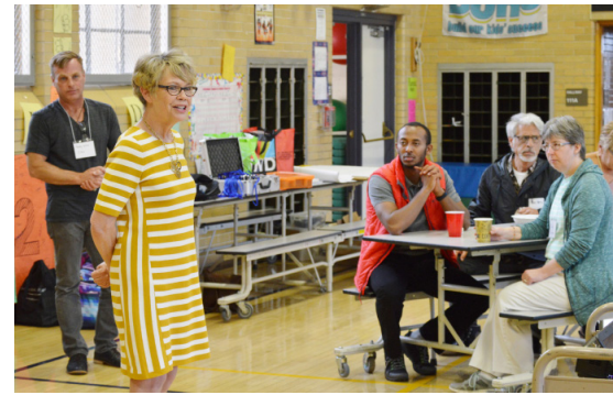
Sesiones de escucha de la comunidad

Se reunieron los comentarios del público mediante correo electrónico, una encuesta en línea, ocho presentaciones comunitarias y dos eventos presenciales para su revisión detallada y comentarios. Se reunieron, revisaron e integraron 1,141 comentarios adicionales en la versión final. Las respuestas de encuestas y eventos resaltaron que el 93.5% aceptó que esta es la Vision correcta para Denver. Casi 3/4 de ellos estuvieron totalmente de acuerdo con la Vision.