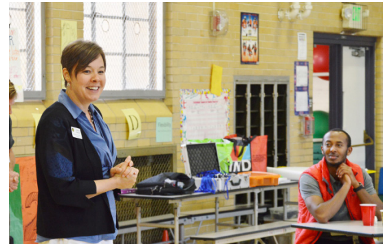
Sesiones de escucha de la comunidad