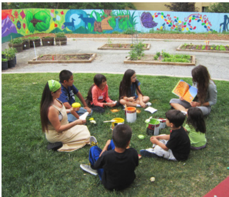
Estudiantes leyendo en el jardín comunitario de Denver Urban Garden (DUG)

12.C. Fomentar oportunidades para compartir alimentos mediante ventas residenciales de productos agrícolas frescos, alimentos caseros, y donar el exceso de alimentos a las despensas locales de alimentos y organizaciones de lucha contra el hambre