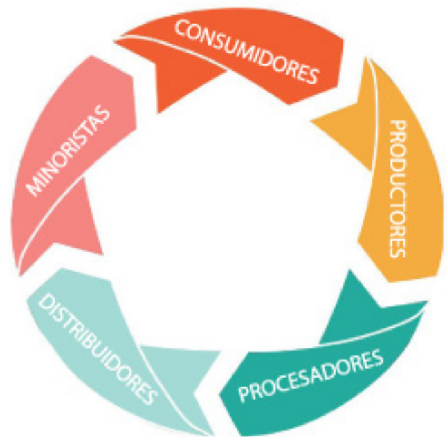
Elementos del sistema alimentario

Los minoristas venden u ofrecen alimentos a los consumidores. Los minoristas comprenden supermercados, tiendas de autoservicio, mercados especializados, servicio de alimentos institucional, mercados de agricultores, restaurantes, escuelas, programas de nutrición familiar, y centros de lucha contra el hambre como las despensas de alimentos.