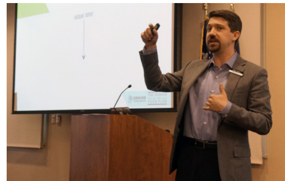
Sesiones de escucha de la comunidad