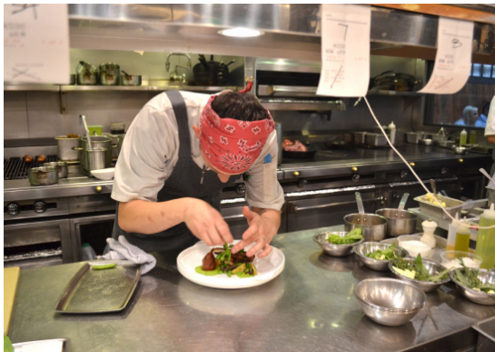
Chef que prepara el plato en el restaurante de la granja a la mesa

V3.F. Identificar y apoyar a microempresas y organizaciones sin fines de lucro que ofrezcan alimentos saludables culturalmente relevantes